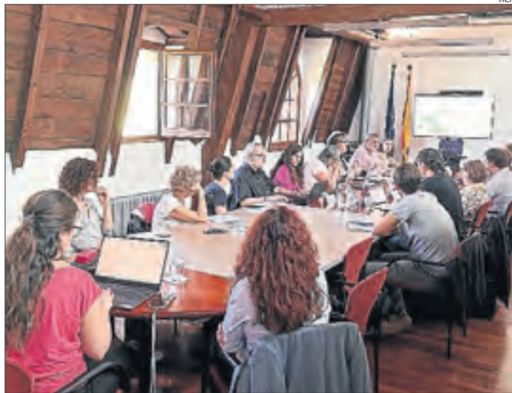
Comissió d'Urbanisme de l'Alt Pirineu i Aran.

Aquest territori, amb 1.708 habitants repartits entre els quatre municipis (abasten 34.606 hectàrees), ha perdut