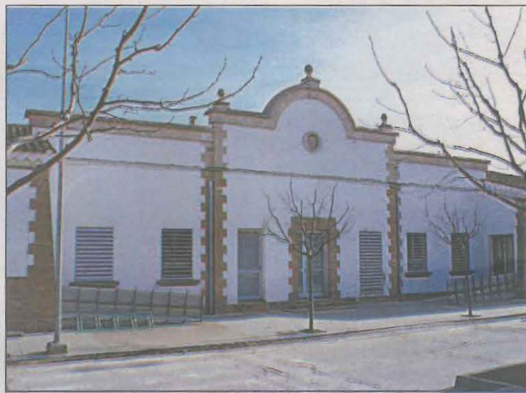
Imatge d'arxiu de la façana de l'Escola Otogesa

D'aquesta manera, veïns i veïnes d'Almatret i Maials no descar-