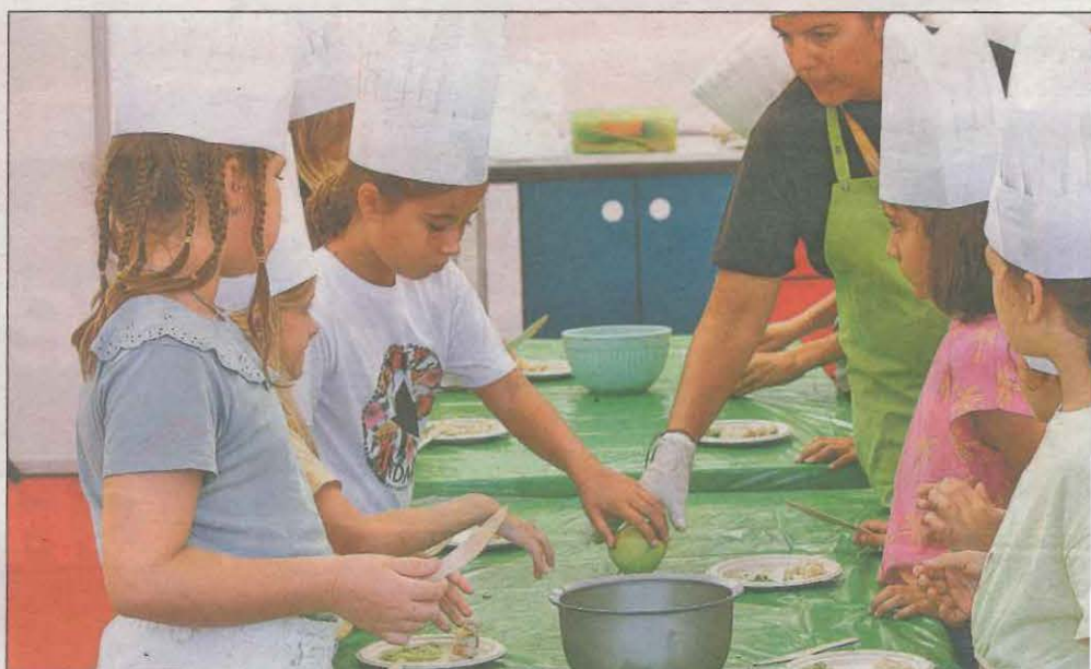
Imatge d'un dels tallers culinàries organitzats, aquest amb nens i nenes.