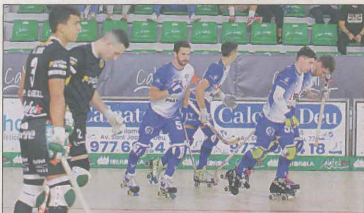
El partido fue vibrante en cuanto a goles en la primera parte

El equipo leridano tomó la delantera en el marcador poco después de comenzar el partido, el rival remontó y finalmente el resultado se quedó en empate a cuatro. | PÁG.31