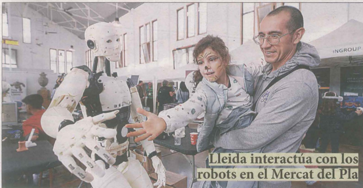
Lleida interactúa con los robots en el Mercat del Pla

La Fira Makers permitió adentrarse en la realidad virtual, la robótica o la fabricación de drones y coetes. LLEIDA | PÁG.11