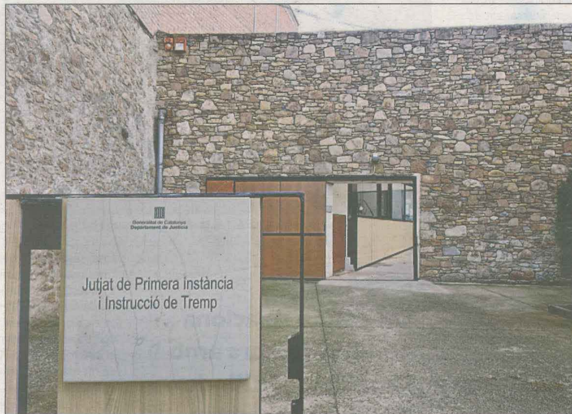
Imatge d'arxiu del jutjat de Tremp, on ahir va passar a disposició judicial el detingut

El cos es va trobar fa uns dos dies i al cap de poc temps es va detenir l'home. Els investigadors van establir com a principal hipòtesi que podria haver-hi un component criminal. La investigació es va iniciar arran de diverses