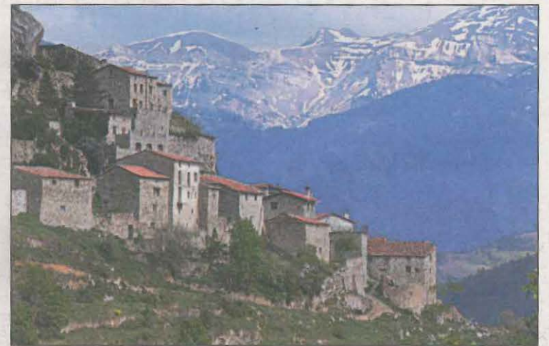
Pla general del municipi del Pont de Bar, a l'Alt Urgell

Els paviments i les instal·lacions soterrades de la plaça es van construir a finals del segle passat, com a conseqüència de les riudes de 1982 i, com assenyalava el consistori, a causa del pas