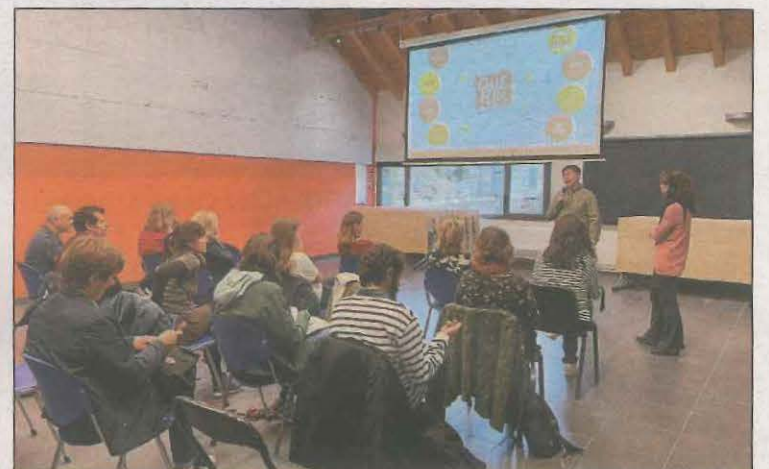
Presentació del projecte Quefers al municipi de Sort