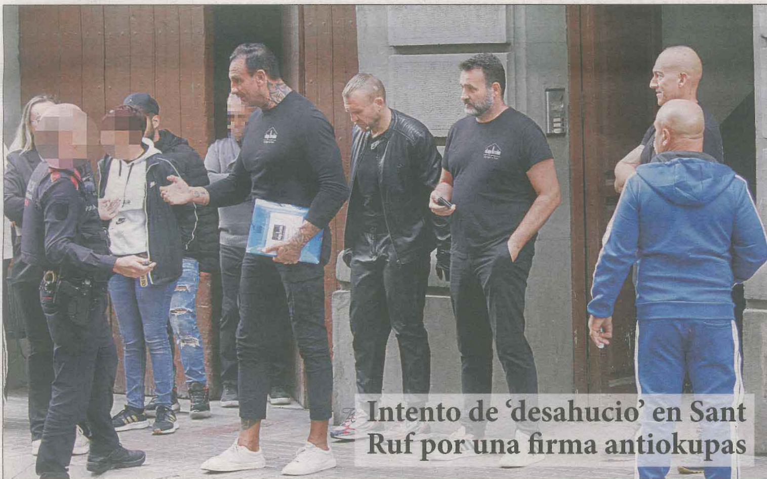
Intento de 'desahucio' en Sant Ruf por una firma antiokupas

La causa está abierta por un delito de homicidio y el detenido se niega a declarar ante la justicia | PÁG. 8