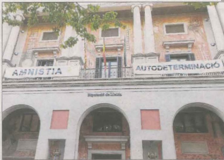
La façana de la diputació de Lleida.

El jutjat contenciós administratiu de Lleida i el Tribunal Superior de Justícia de Catalunya (TSJC) han rebutjat aquest any peticions del funcionari per continuar de forma cautelar al seu lloc fins als setanta anys. Va complir el mes de febrer passat els seixanta-cinc anys, l'edat en què s'havia de declarar la seua jubilació forçosa. La Diputació va dictar llavors una