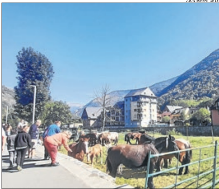
Cavalls ahir a la fira ramadera de Les.