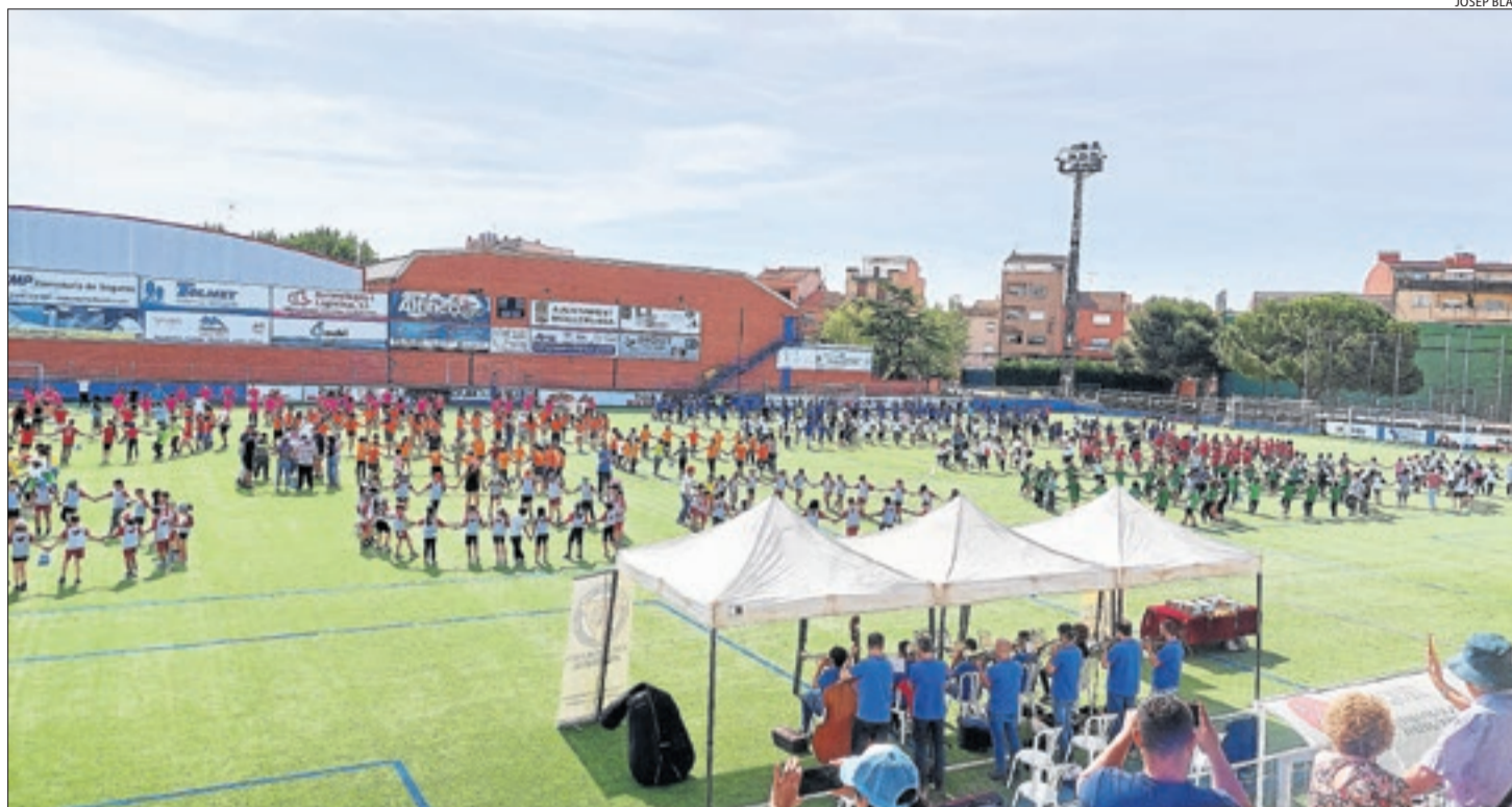
Trobada d'aquest any a Mollerussa.