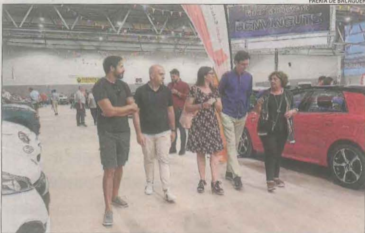
Jornada ahir a la 31 edició de Firauto de Balaguer.