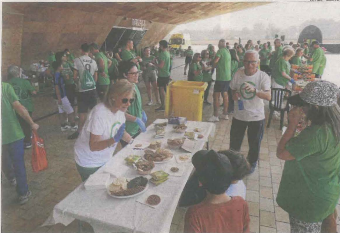
Participants in the march gathered at the starting point at the Llotja de Lleida.