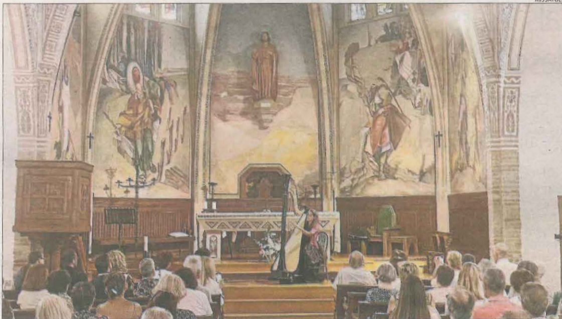
L'església del Sagrat Cor de Raimat va acollir ahir a la tarda el concert final del Raimat Arts Festival.

RAIMAT | El Raimat Arts Festival, que organitza el Castell de Raimat per promocionar i presentar els projectes de la Fundació Comunitària Raimat Lleida, va tancar ahir diumenge la segona edició plenament consolidat amb la seua proposta de fusió musical i gastronòmica. "Hem constatat i estem convençuts que el Raimat Arts Festival pot ser una palanca de transformació que apporti riquesa al territori des de l'economia regenerativa entorn de la música, la gastronomia i el respecte cap al medi natural que ens acull", va afirmar Elena de Carandini, presidenta de la fundació i propietària del Castell de Ray-