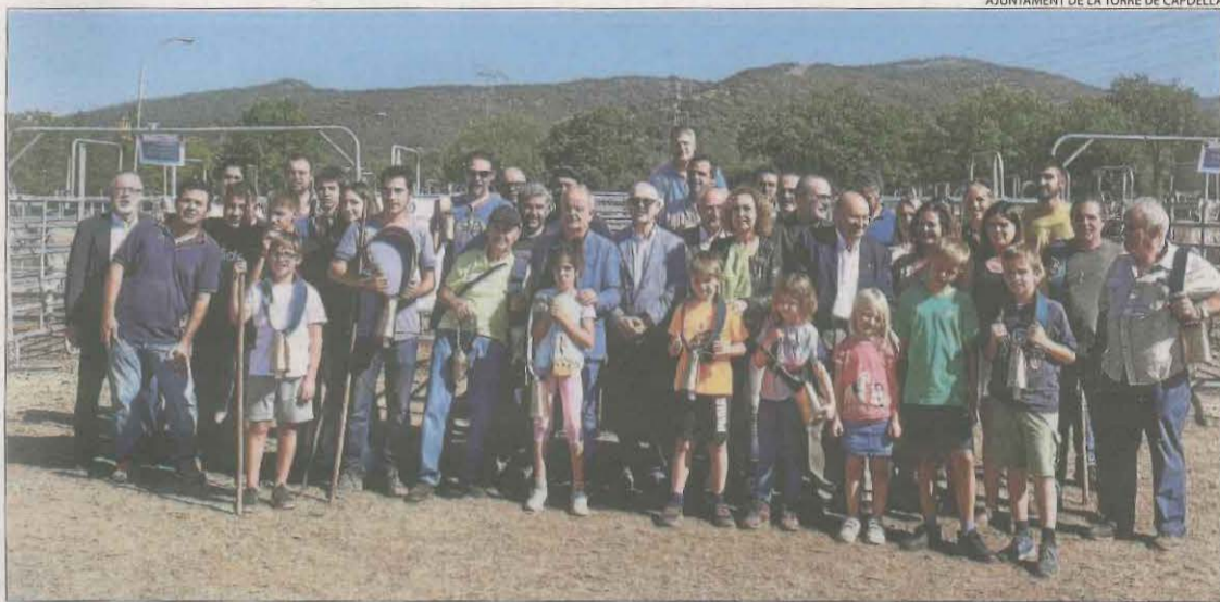
Fotografia de grup en la jornada d'ahir a la fira ramadera de la Pobleta de Bellvé.

La fira ramadera acull més de 6.000 visitants || Unes 4.500 persones van passar durant el cap de setmana per Firauto