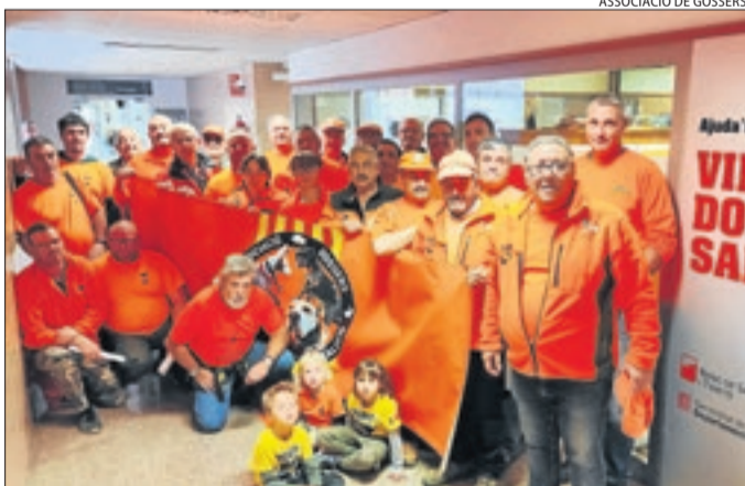
Els membres de l'Associació de Gossers que van donar sang.