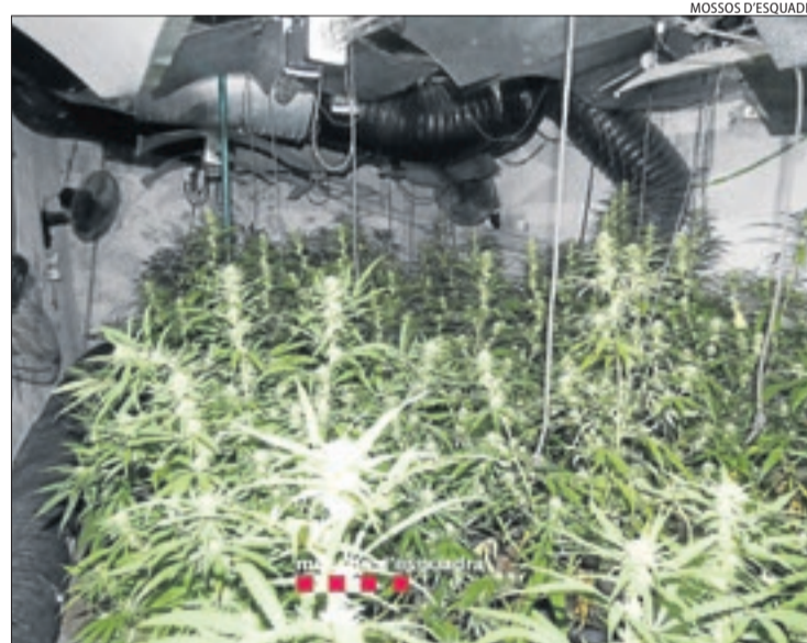
Una de les plantacions confiscades dijous a Castellserà.

Els Mossos van confiscar 126 plantes en producció i 1.300 esqueixos de 'maria' i van arrestar vuit persones