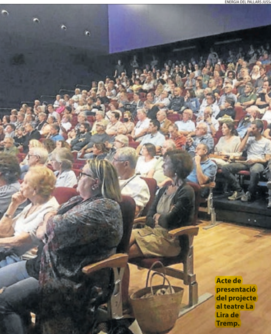
Acte de presentació del projecte al teatre La Lira de Tremp.