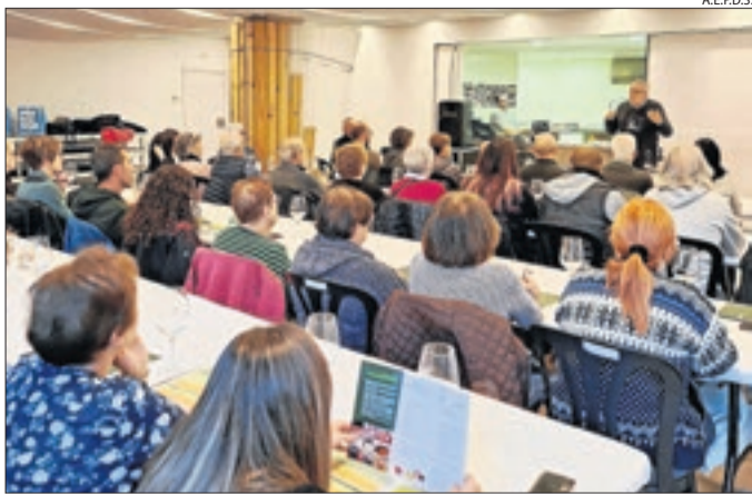
La degustació d'embotits al Pont de Suert.