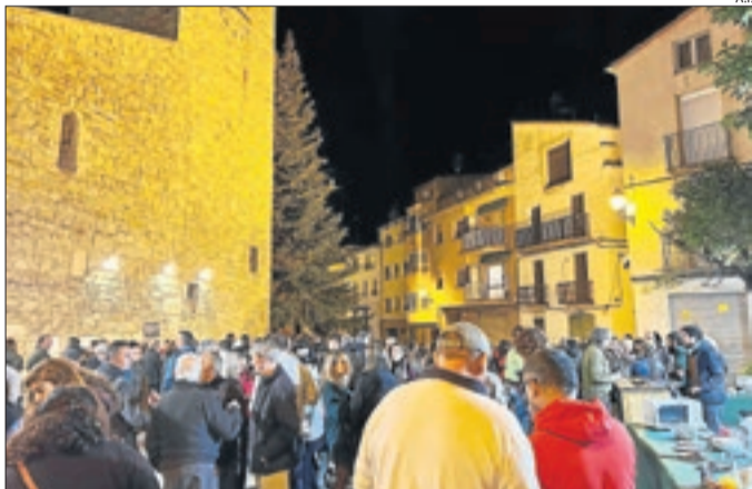
El Boletast que es va celebrar ahir a Isona.