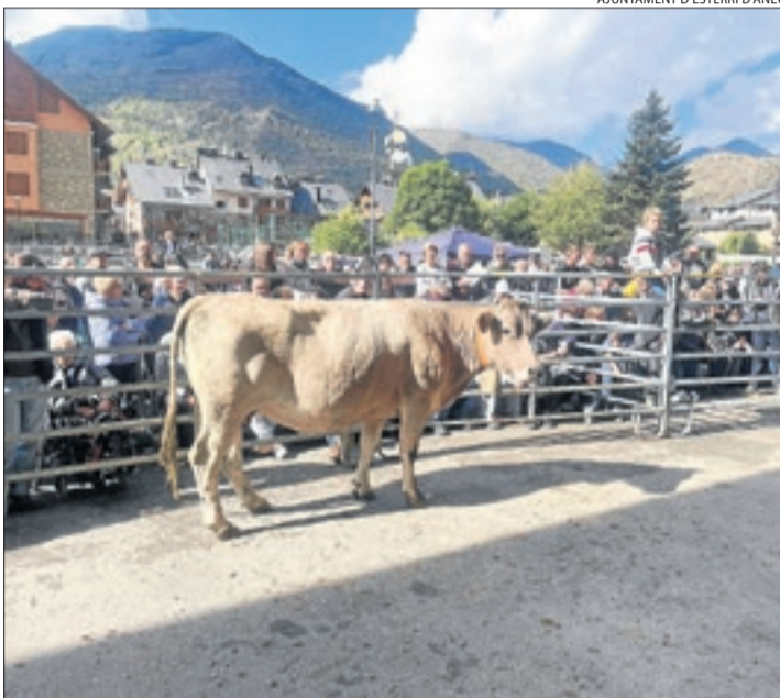
AJUNTAMENT D'ESTERRI D'ÀNEU

Subhasta amb preus d'entre 600 i 800 euros per als vedells i de fins a 1.200 euros per als toros