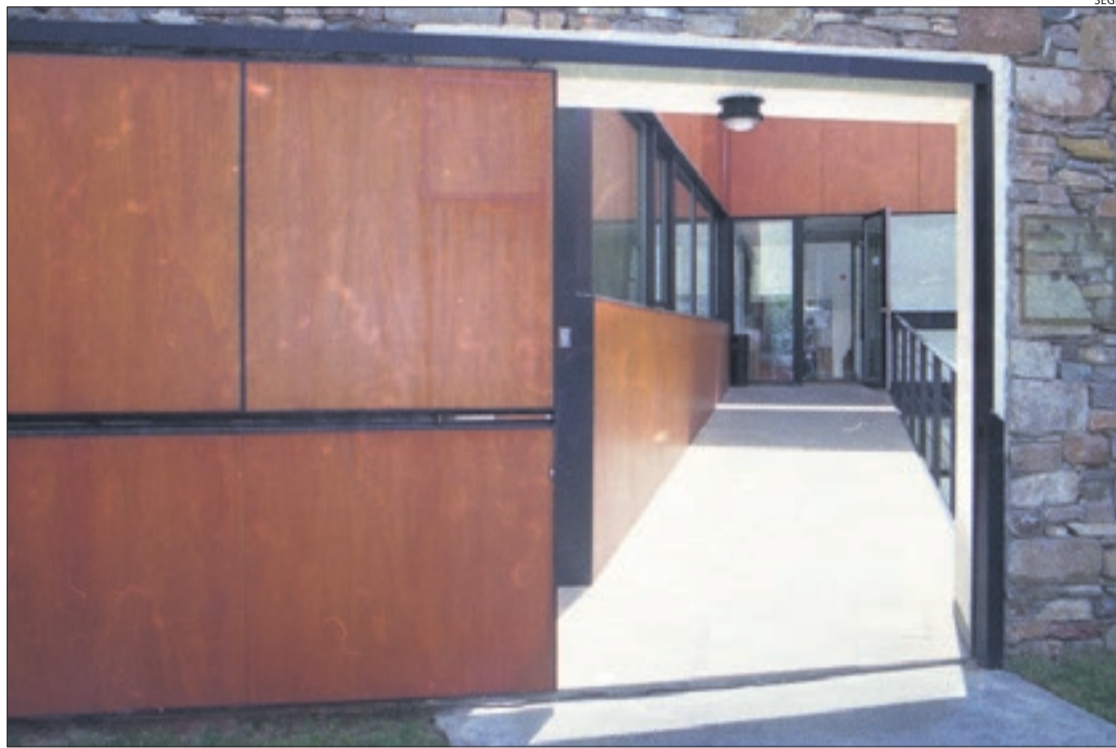
Imatge d'arxiu del jutjat de Tremp.

El cadàver estava enterrat en una zona d'horts de Torallola, a prop de la casa familiar del detingut