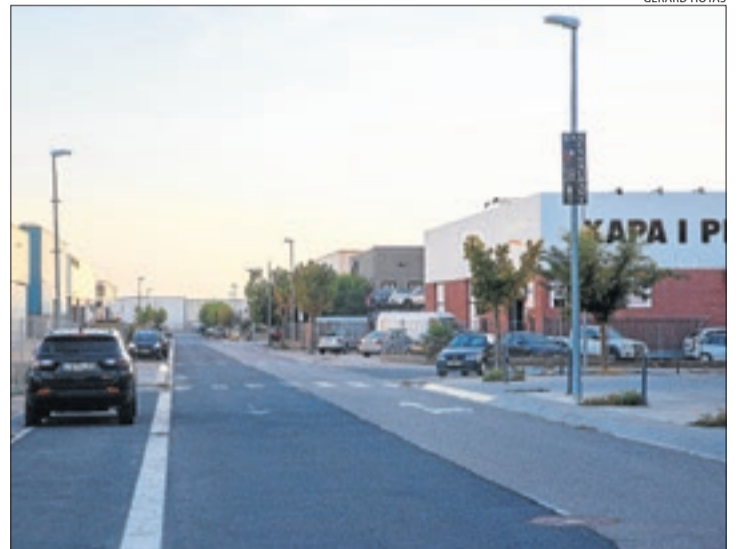
Imatge del polígon Camp Llong de Balaguer aquest mes.

La majoria de firmes instal·lades al polígon industrial es proveeixen per ara amb aigua embotellada, a l'espera que es trobi una solució al problema. El regidor va explicar que, dels diferents punts de captació d'aigua, només la que es pren de la Séquia del Molí del Comte ofereix uns resultats òptims