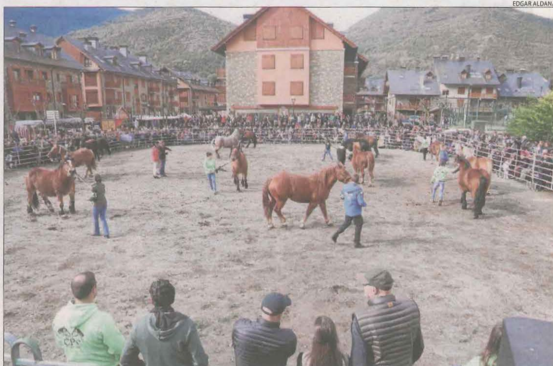
Imatge del concurs per elegir el millor exemplar de cavall de raça pirinenc català, ahir a Esterri.