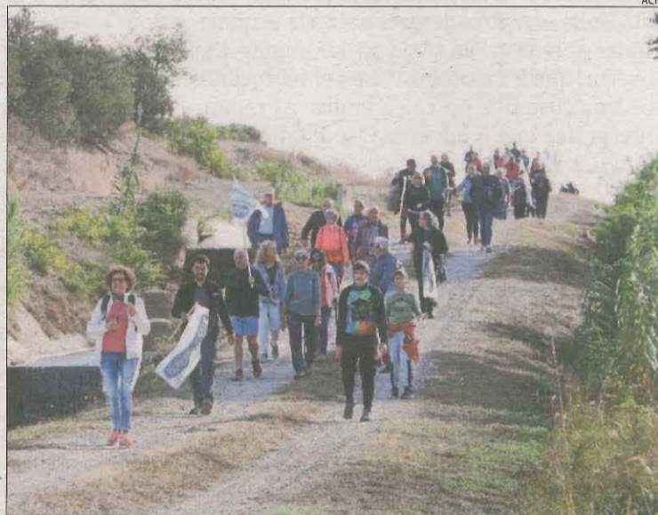
Un moment de la marxa en contra del projecte.