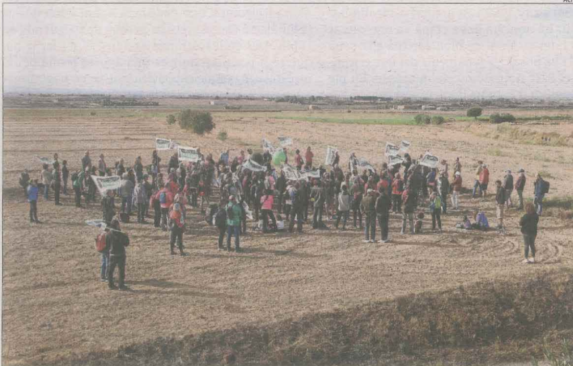
Participants en la protesta a la zona on es planteja construir la planta de biogàs de la Sentiu.

Des de tres pobles fins al municipi per protestar contra el projecte, que va rebre un miler d'al·legacions || També demanen retirar la declaració d'"estratègic" i asseguren que té "carències tècniques"