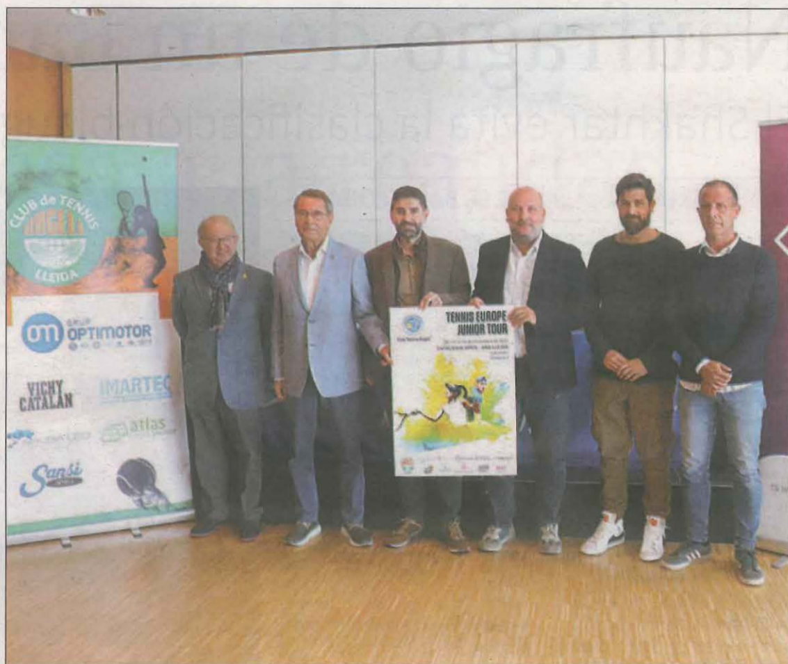
La presentación tuvo lugar ayer en La Llotja con los organizadores y las autoridades

Los detalles más técnicos los ofreció su director, Jaume Lluís Fontanet, destacando que Lleida reunirá 80 tenistas en sus cuadros grandes individuales, 48 en el masculino y 32 en el femenino. En dobles habrá 24 y 16 parejas. Las finales serán el domingo 19. Destaca la presencia del toledano