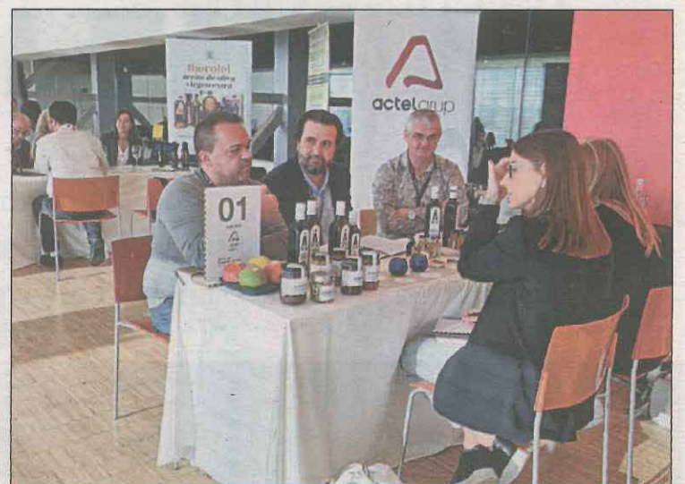
Una de les reunions entre productors i compradors