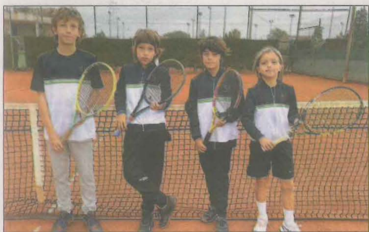
El joven equipo del club leridano