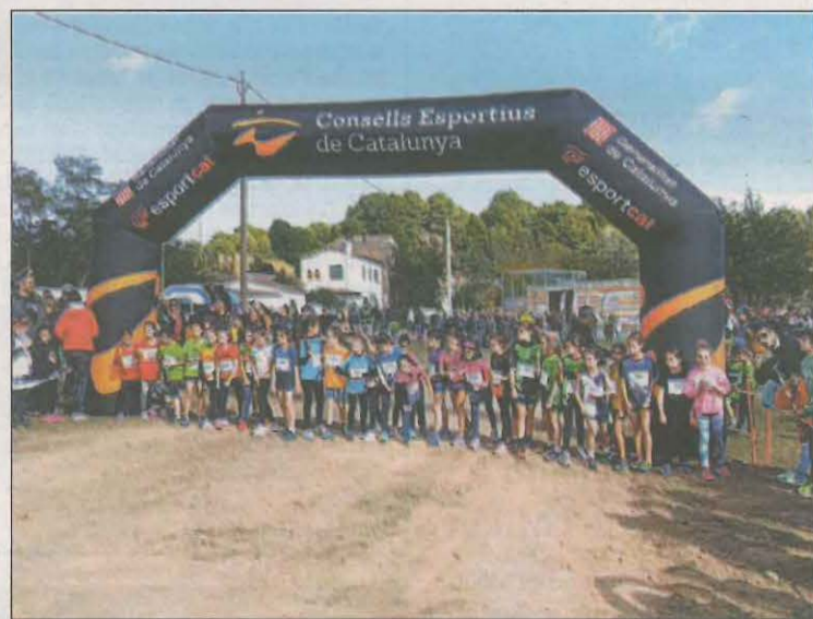
Una de las pruebas de la jornada atlética

En esta edición, el cros entró dentro del circuito escolar del ATCELL (Agrupació Territorial de Consells Esportius de Lleida). Como novedad, destacar que es el primer cros del Segrià que se añade en este circuito. La Actividad tuvo una duración de 4 horas, de las 10.00 hasta las 14.00 horas, donde acogió a deportistas de todas las categorías/edades, de 3 años hasta categoría sénior/vete-