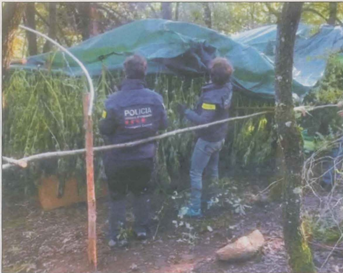
Moment en què els agents de la policia catalana va accedir a un dels campaments

A finals de 2022, la Unitat d'Investigació de Tremp va localitzar a Sarroca de Bellera un espai desforat que es podia haver utilitzat com a plantació. A finals d'abril de 2023 es va reprendre l'activi-