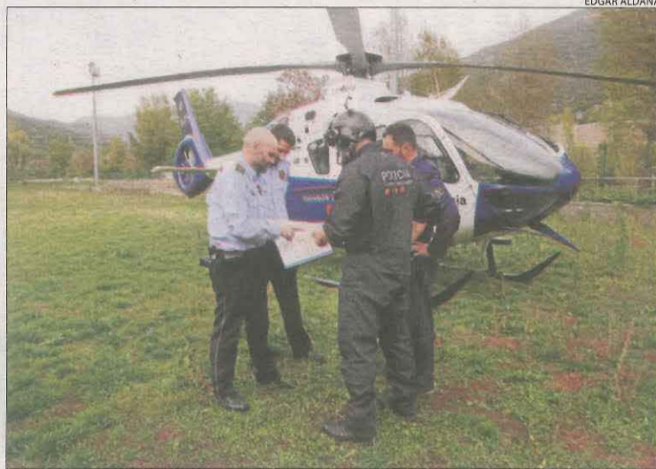
Mossos i Bombers van desplegar un ampli dispositiu.