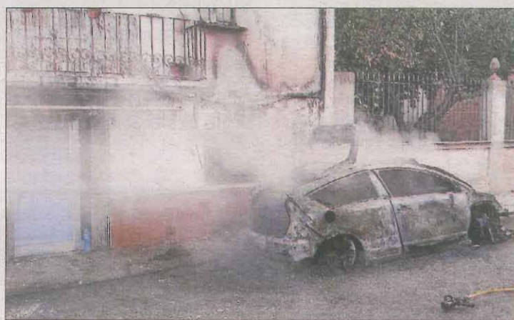
El cotxe va quedar completament calcinat.