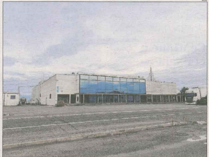
Imatge de la façana de la discoteca Big Ben de Golmés.

L'antiga discoteca estava a la venda fa dos anys per aproximadament 1,3 milions d'euros, encara que el preu actu-