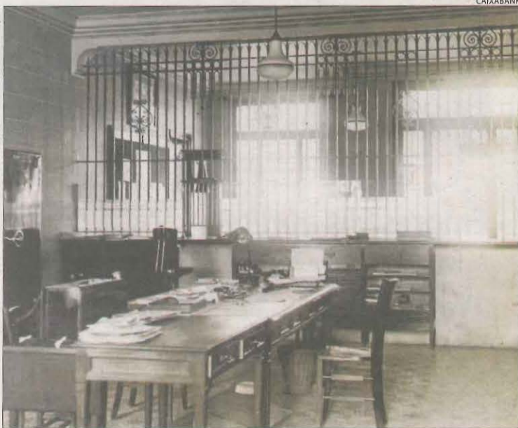
Imatge històrica de l'oficina de Tremp, molt diferent a la d'avui.

TREMP | CaixaBank celebra aquest any el centenari de la seua presència al municipi de Tremp. L'oficina de la ciutat, ubicada des dels seus inicis a la rambla Doctor Pearson, 11, es va inaugurar el dissabte 22 de desembre del 1923. Avui el banc compta amb tres oficines al Pallars Jussà, amb tretze empleats i gairebé 8.000 clients. CaixaBank ha transformat l'oficina de Tremp, "adequada als nous temps", explica l'entitat.