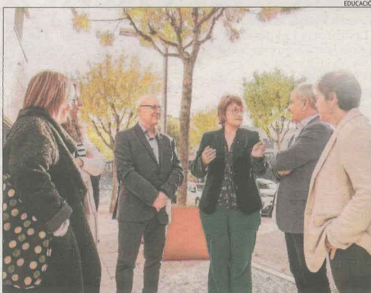
La consellera Anna Simó ahir a Tremp.

| LLEIDA | La consellera d'Educació, Anna Simó, va visitar ahir les noves dependències del servei d'Educació a l'Alt Pirineu i Aran a Tremp per conèixer el desplegament territorial que s'està portant a terme des de la seua creació el mes de març del 2022. El passat dia 1 d'octubre va entrar en funcionament l'estructura dels serveis territorials, que inclouen les comarques de l'Alta Ribagorça, Jussà, Sobirà, Alt Urgell, la Cerdanya gironina i Aran, que sumen més de 10.600 alumnes i tenen una plantilla docent de 967 persones. Els serveis territorials comptaran amb una dotació de 35 professionals. Simó es va re-