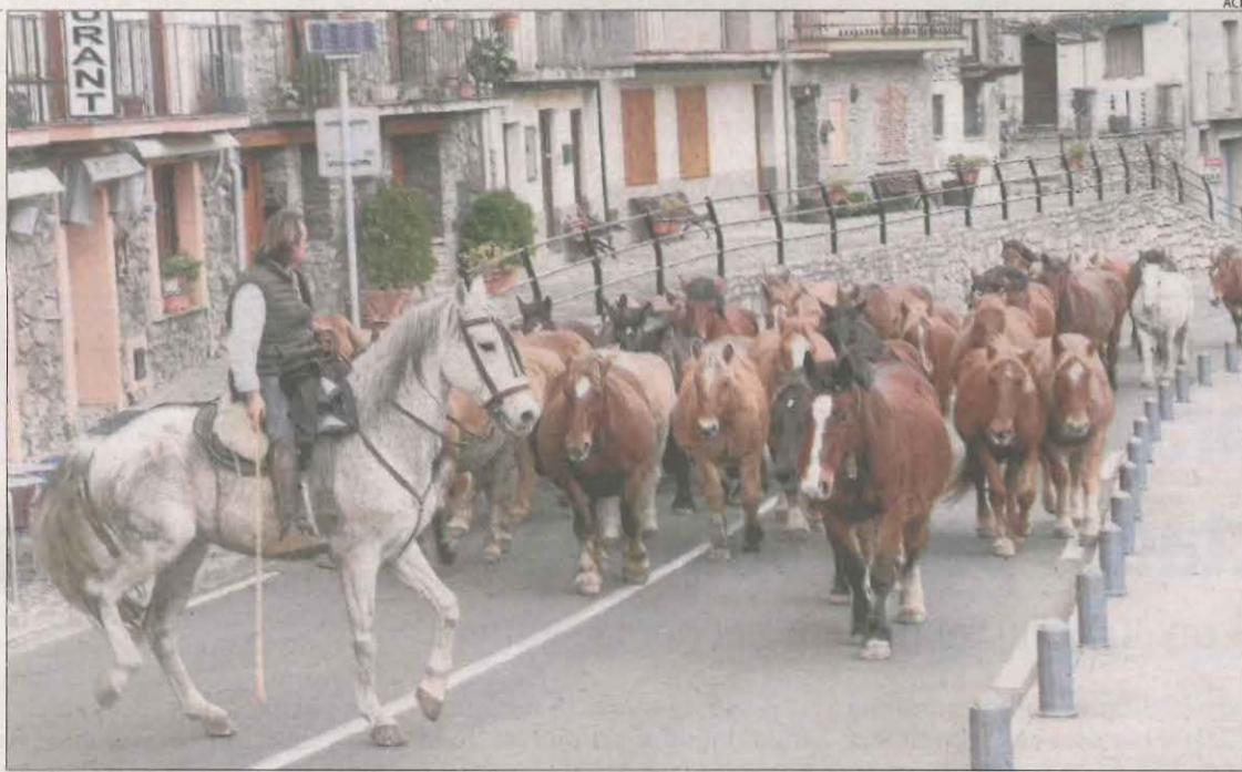
Els cavalls creuant dilluns Gerri de la Sal per l'Eix Pirinenc, l'N-260.