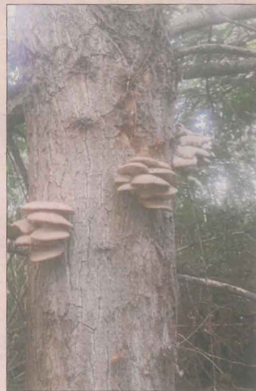
A l'arbre. El Sergi captura aquesta meravella de la naturalesa al parc de la Mitjana de Lleida.