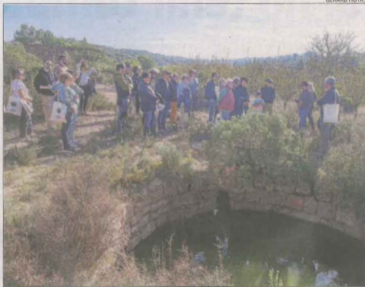
La sessió a Torrebeuses del congrés sobre la nova ruralitat.