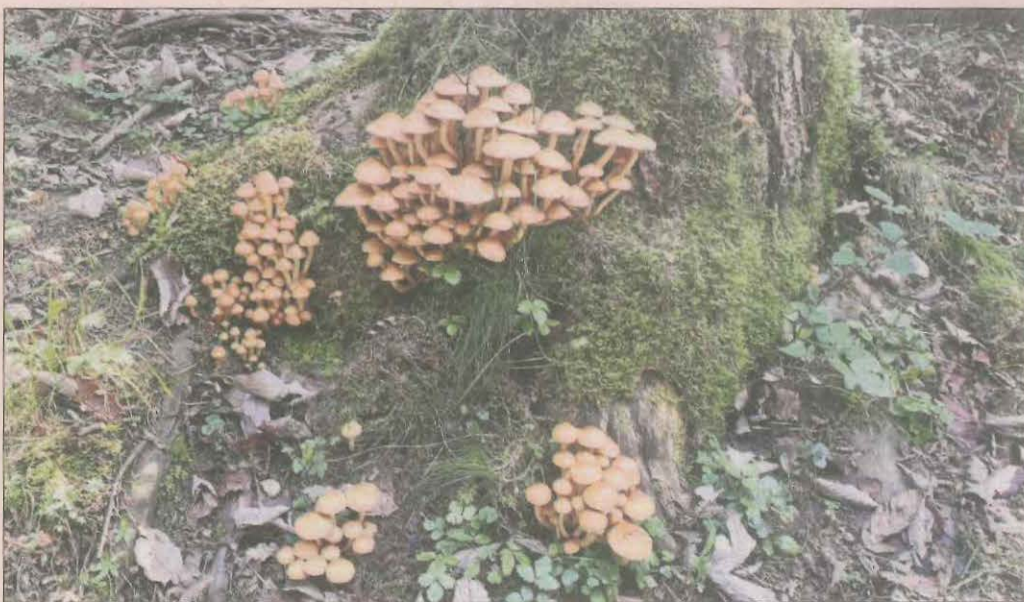
Caminant pel bosc. Fotografia del Jordi d'uns bolets de diferents mesures a Aïnsa.