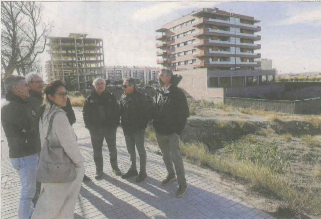
Responsables i tècnics d'Interior, Mossos, Rurals i la Paeria van visitar ahir el solar.