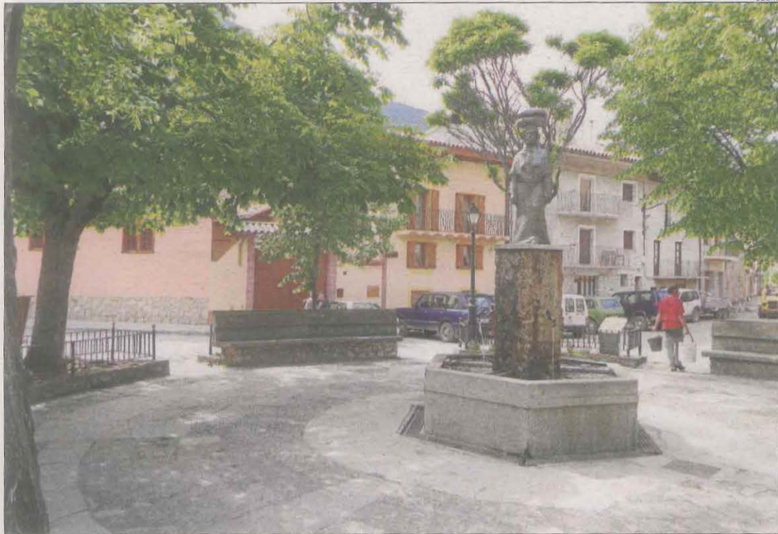
La plaça de Gósol amb una escultura de la dona amb els pans.

L'únic poble lleidatà del Berguedà creu que el canvi li aportaria més ajuts i serveis || Inicia consultes amb el Govern espanyol i la diputació barcelonina