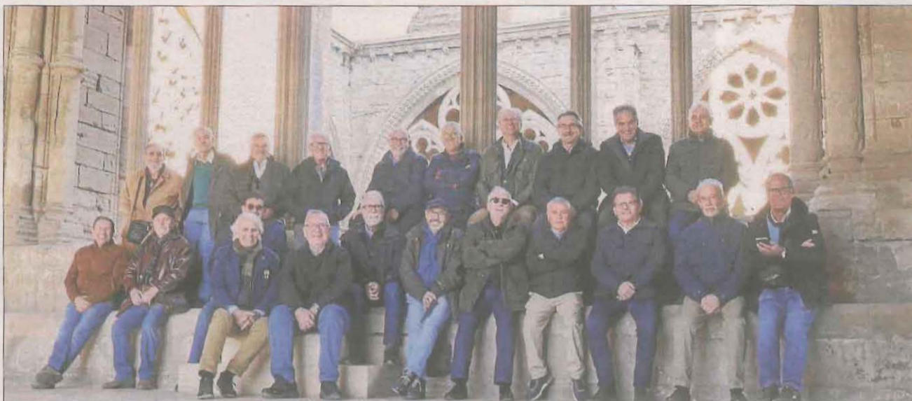
Visita. Alumnes de la promoció 1972-1973 del Col·legi Sant Jordi es van retrobar per celebrar els 50 anys del final dels seus estudis. Van visitar la Seu Vella, amb el guiatge de l'Associació Amics de la Seu Vella i la col·laboració del Consorci del Turó.