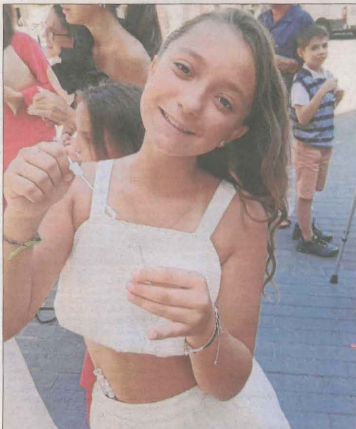
Avui la princesa de casa en fa 13... gràcies per ser com ets. T'estimem!