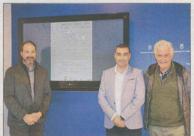
Moment de la presentació que es va fer divendres

D'aquesta tercera edició de la fira destaca la inauguració de l'exposició Musicadures de pastor , al Pati de la Casa Gran, centrada en la vida d'aquestes persones. La mostra oferirà objectes relacionades amb aquest ofici, com decoracions en fusta (collars d'ovelles, culleres, pipes o flabiols) o un maniquí abillat amb un vestit de pastor, entre altres. També inclourà plafons on s'explicaran aspectes com el nom de les ovelles segons el seu estat i edat, el paper dels gossos de pastura, la