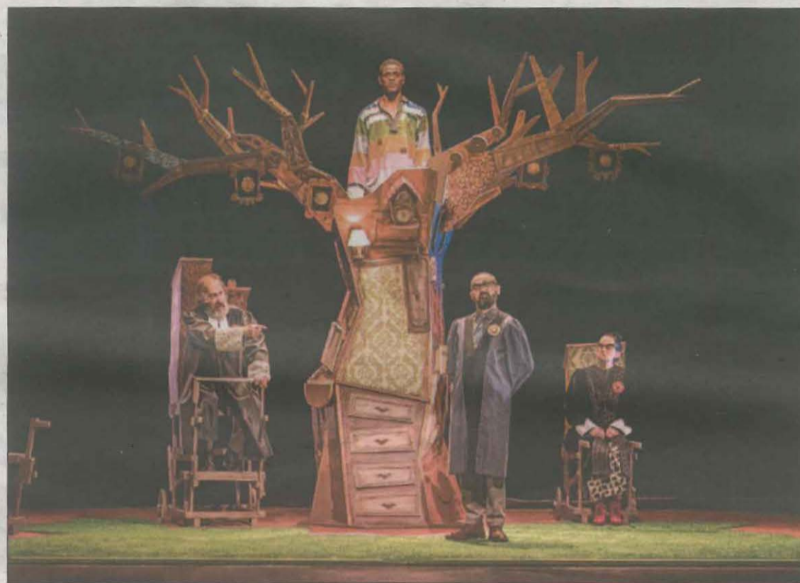
FOTO: Zum Zum T. / Zum Zum Teatre, que organitza el festival, actuarà el dia 31 amb 'Soc una nou'

El dijous dia 28 (18.00) serà el torn de Solo , de Roi Borallas, un espectacle de clown per riure i divertir-se, mentre que el divendres