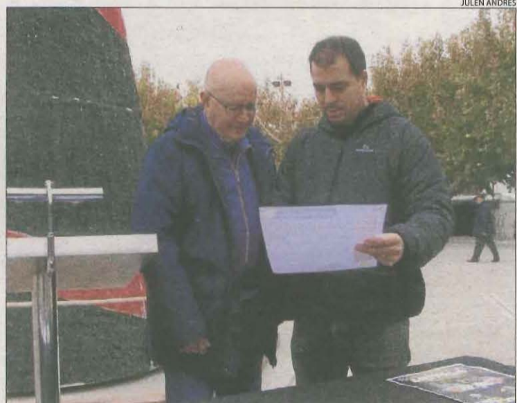
Linyola encén avui els llums de Nadal.

La campanya comercial de Nadal compta amb el suport de l'ajuntament i ha previst diferents activitats que s'allargaran fins a la cavalcada de Reis (5 de gener) per amenitzar les compres. Entre aquestes, el concert de Fauna el dia 15 de desem-