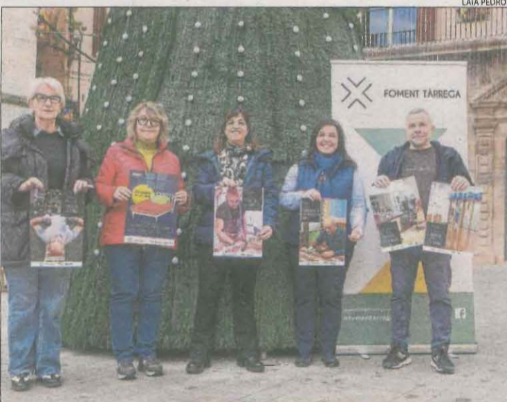
Foment Tàrraga va presentar ahir la campanya nadalenca.

Per recollir els fomentins , s'habilitarà un estand al Llaberint del 18 al 23 i del 27 al