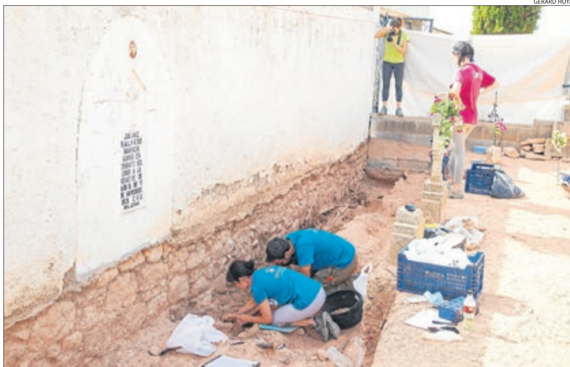
Intervenció arqueològica l'estiu passat a la fossa del cementiri de Bovera.

Per la seua part, la consellera de Justícia, Gemma Ubasart, va anunciar les pròximes obertures de fosses, que es començaran a excavar durant el mes de gener. Entre aquestes es troba la fossa de Coll Roig, situada a Bovera, com ja va publicar SEGRE, i on hi hauria restes d'uns quinze soldats republicans que estaven amagats i que van ser capturats i afusellats per les tropes rebels. D'altra banda, també es preveuen actuacions als municipis d'Almatret, Bellaguarda i Isona i Conca Dellà. Les intervencions es faran en funció del risc de desaparició de les fosses, prioritzant aquelles que estiguin fora dels cementiris, ja que corren més perill. Així mateix, Ubasart va fer balanç de les actuacions dutes a terme aquest any, amb l'exhumació d'un total de 124 cossos. Dos d'aquestes van tenir com