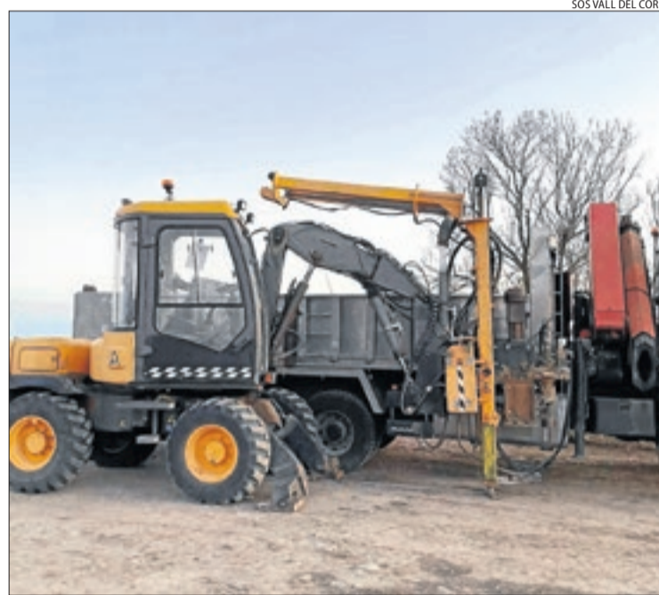
Part de la maquinària utilitzada en els treballs.