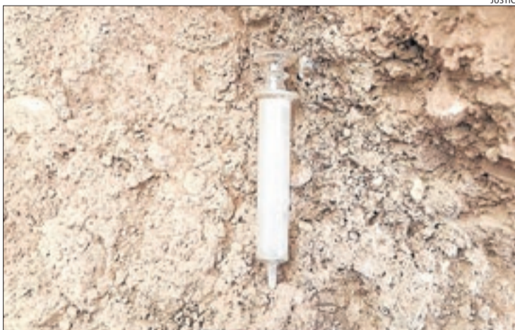
Un objecte recuperat de la fossa al cementiri de Bovera.