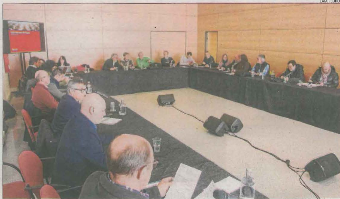
La taula de l'aigua es va celebrar a Tàrrega i va reunir sindicats, regants, administració i empreses.

La comissió de la Taula de la Sequera a Lleida fa una crida també a instal·lar comptadors || Plantegen 70 propostes de millora