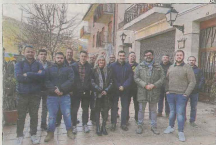
Bombers voluntaris i representants polítics, ahir a Sort.