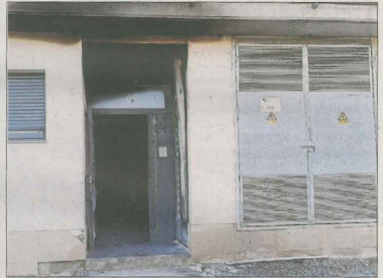
Imatge de l'entrada en la qual es va cremar el quadre elèctric.

El primer edil va assegurar que existeixen diverses denúncies en aquest sentit i que el consistori no ha pogut contactar amb el propietari de l'immoble (una filial de La Caixa). Mentrestant, va assegurar que es treballa des de diferents organismes (Justícia, Interior i Drets Socials) per trobar una solució.