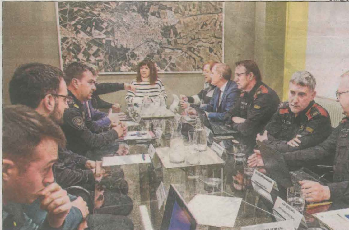
Un moment de la reunió de la Junta de Seguretat Local de Tàrrega, ahir al matí.