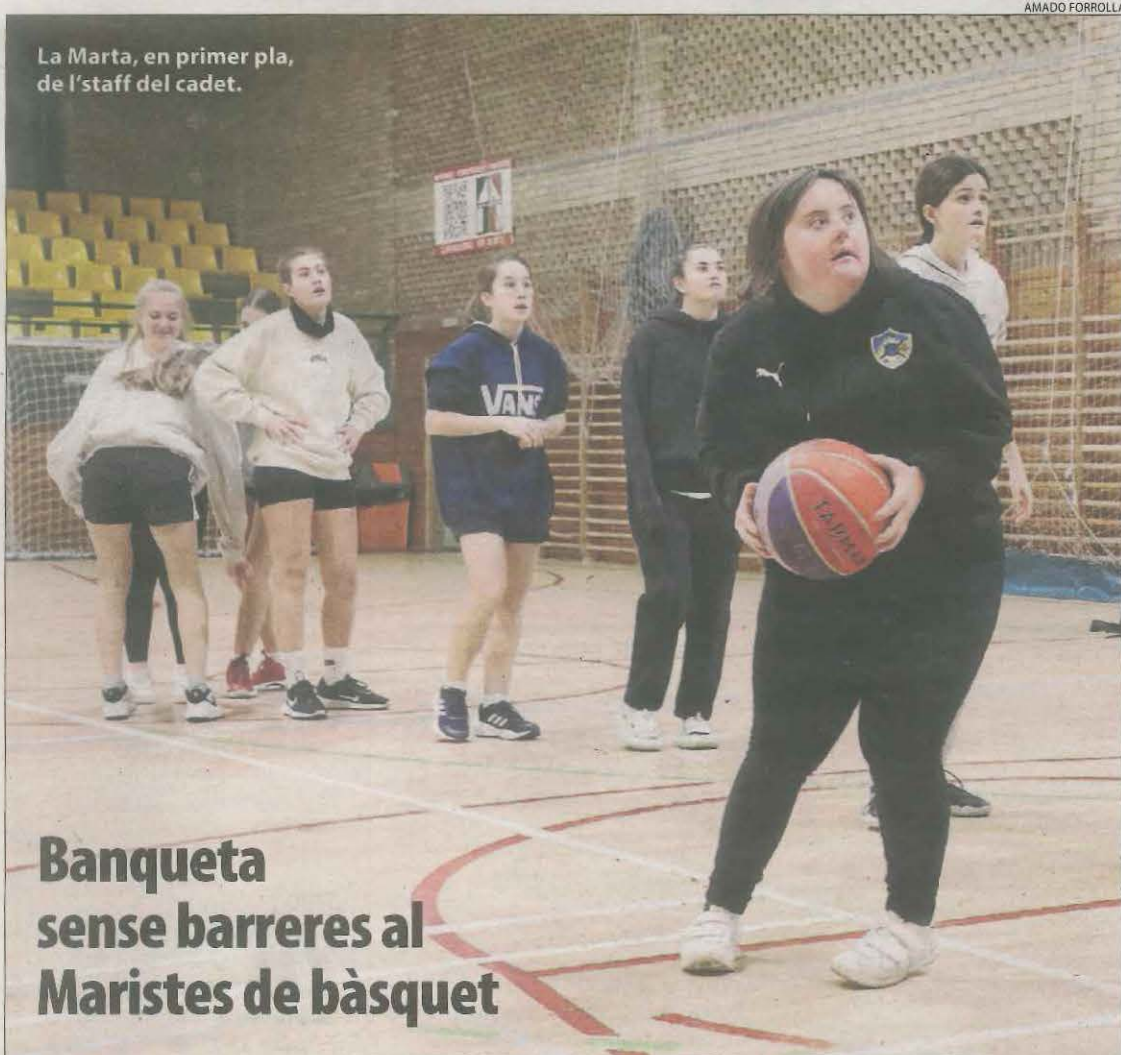
La Marta, en primer pla, de l'staff del cadet.

Educació va notificar ahir a tots els centres públics que imparteixen FP que l'Estat es farà càrrec del cost de donar d'alta a la Seguretat Social tots els alumnes en pràctiques en empreses a partir de l'1 de gener, dia en què entra en vigor una llei que hi obliga i després de les queixes d'algunes firmes.