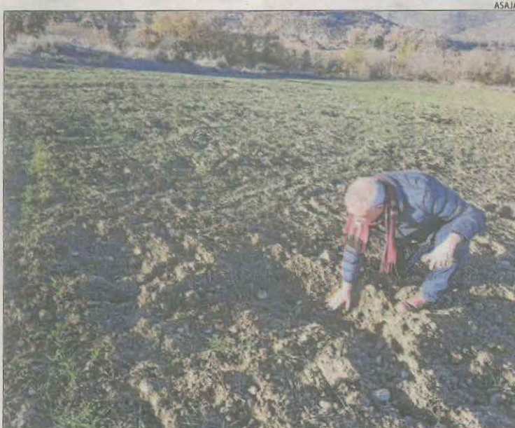
Un agricultor de Sant Esteve comprova els danys a l'ordi.

Disturbis. El consistori va demanar més presència policial al detectar una onada de robatoris al centre i intents d'okupació, que podrien tenir relació amb habitants d'aquest immoble.