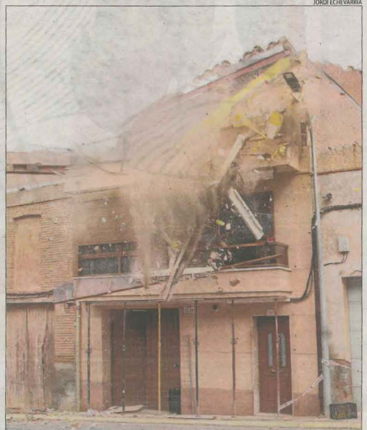
La casa es va desplomar just després que se n'iniciés la demolició.

ALCOLETGE | Una retroexcavadora va demolir a primera hora d'ahir la casa situada a l'avinguda Catalunya d'Alcoletge que dissabte es va esfondrar parcialment. L'estructura es va col·lapsar en pocs minuts i en les pròximes hores els operaris s'encarregaran de rescatar entre la runa els objectes personals dels propietaris, que dissabte van ser desallotjats i es van traslladar a la casa d'un familiar. Pel que sembla, hi van detectar unes esquerdes divendres a la tarda i, dissabte, l'immoble es va esfondrar parcialment sense causar ferits. L'habitatge havia estat reformat i els fonaments eren de tova en una zona on hi ha humitat, segons fonts municipals.