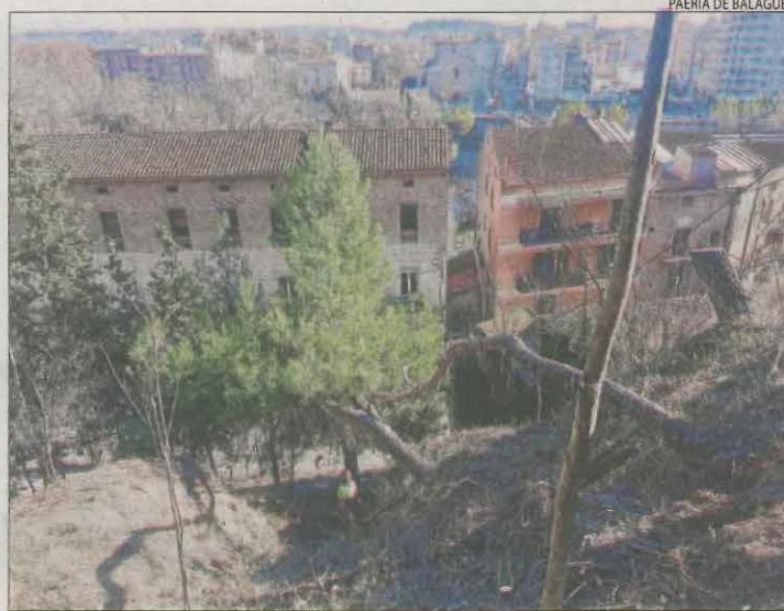
Operaris treballant en la retirada de vegetació.

| BALAGUER | La Paeria de Balaguer ha dut a terme una neteja forestal i desbrossament del terreny del carrer Pla Almatà, com a mesura de prevenció d'incendis forestals en zones verdes, parcel·les interiors municipals i instal·lacions ubicades en terrenys forestals. També s'ha millorat la vegetació de la zona del parc del Real.