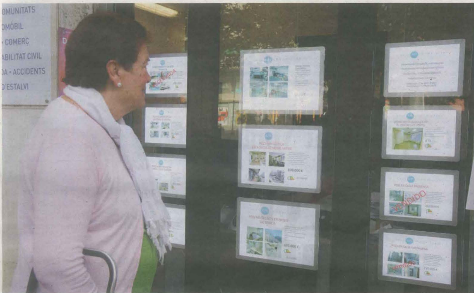
Una dona mira un aparador d'una immobiliària amb cartells de pisos de lloguer

La mesura que entrarà en vigor al febrer afecta localitats com Lleida, Balaguer, Tàrrega, Cervera, Tremp, Guissona i Mollerussa