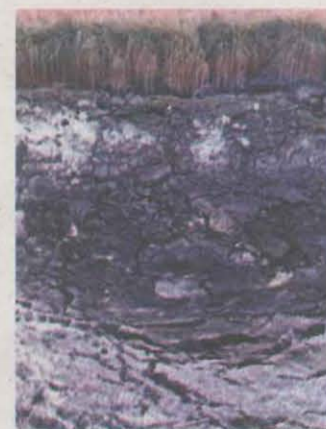
Els estanys de Basturs, sec per la falta d'aigua