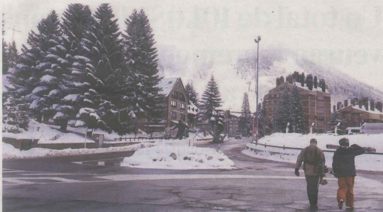
Aspecte de l'estació d'esquí de Baqueira, ahir, després de les últimes nevades