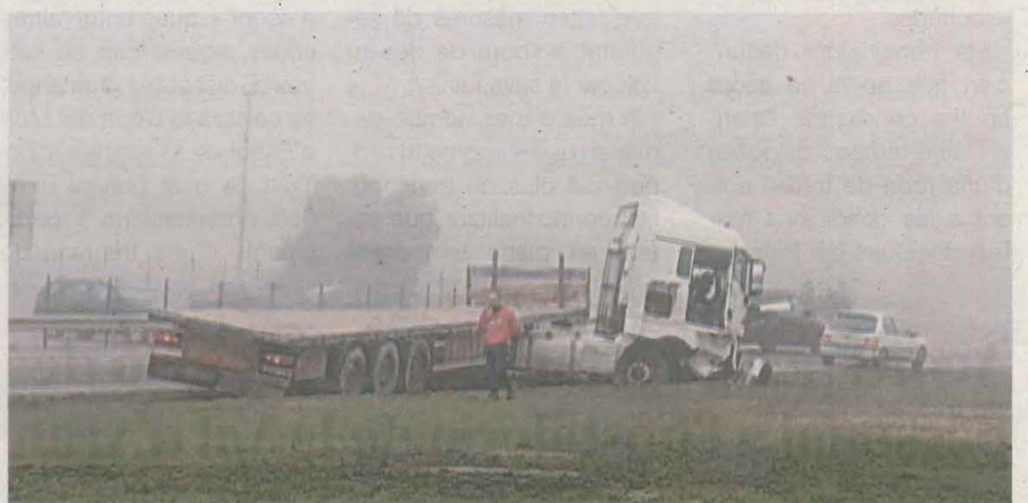
Estat en què va quedar el camió accidentat a la C-13, a Alcoletge

local cedit pel Consell Comarcal del Ripollès, i la Federació d'Autoescoles de Girona coordinarà la posada en marxa d'aquest procés. A més, des de l'SCT es va tornar a reclamar a la DGT el traspàs de les competències al govern català per fer els exàmens pràctics de conduir.