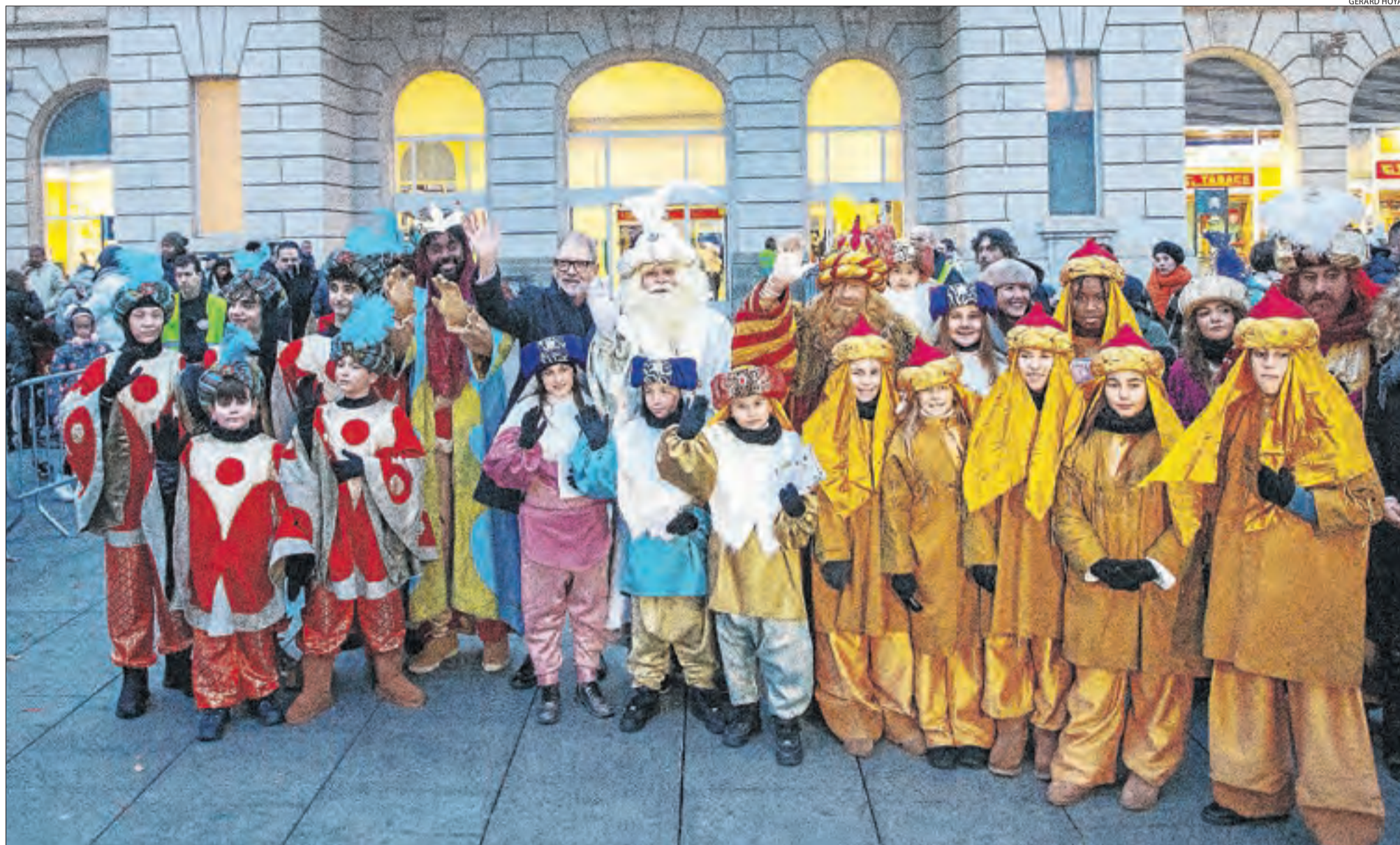
Melchior, Gaspar i Baltasar van arribar puntuals a l'estació Lleida-Pirineus, on els esperaven algunes autoritats, com l'alcalde, i milers de nens i nens il·lusionats.