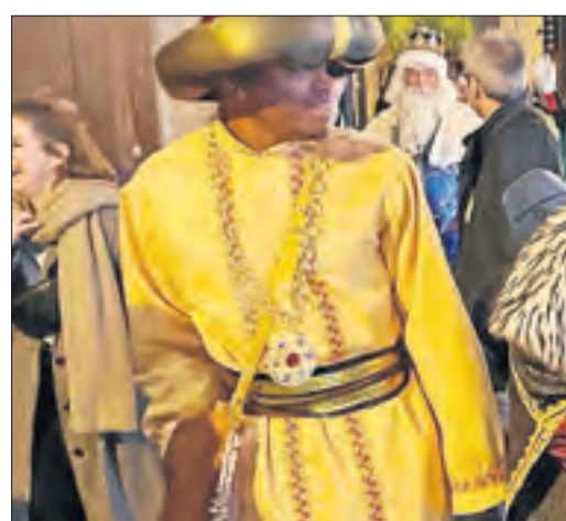
Solsona. Encara que la cavalcada es va recórrer els carrers del centre fins al pavelló