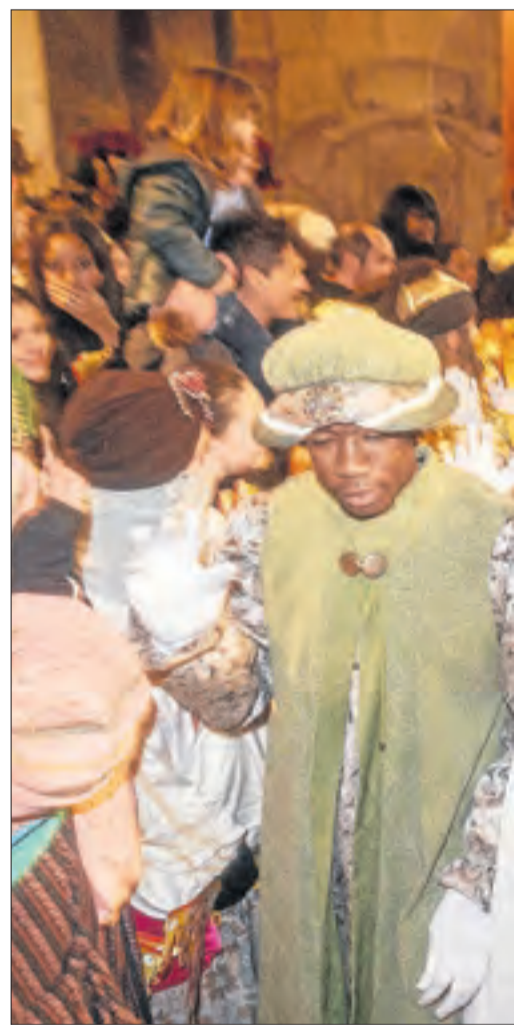
Tàrraga. La comitiva va esperar gairebé una suspensió i l'acte es va traslladar a l'església de