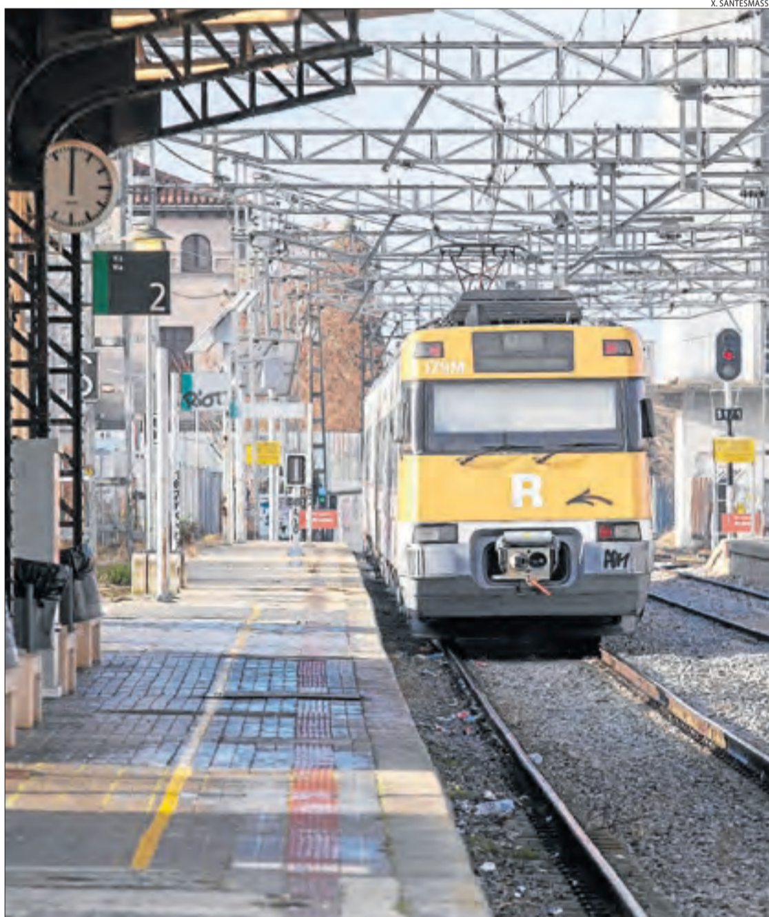
Imatge d'arxiu d'un tren de la línia de Manresa a l'estació de Cervera.