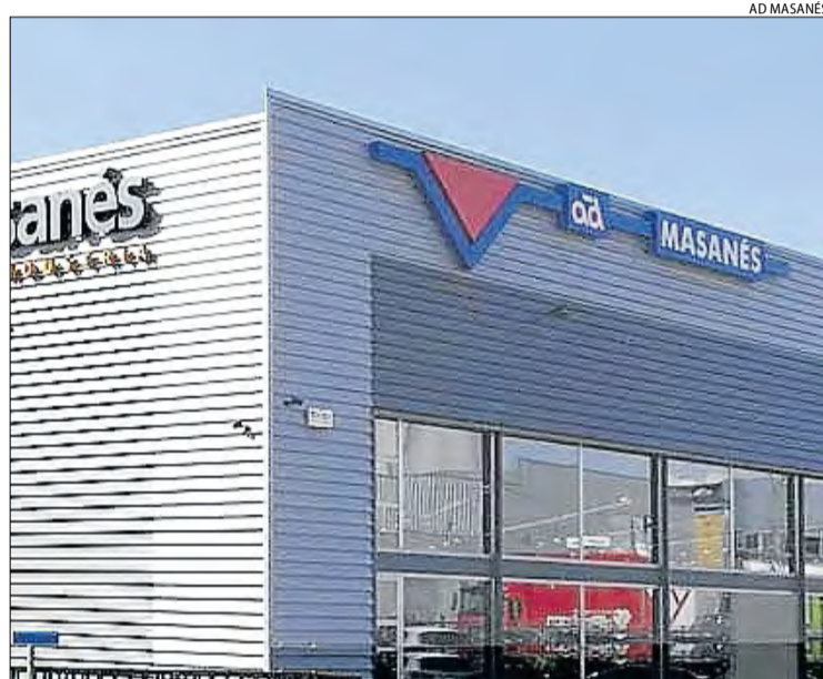
L'empresa ha estat guardonada per la Cambra de Tàrrrega.

Amb aquesta operació, el Grup PHE, a través d'AD Parts Intergroup, fa un nou pas en el seu desenvolupament en el