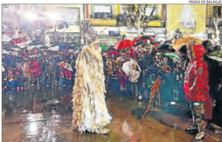
PAERIA DE BALAGUER