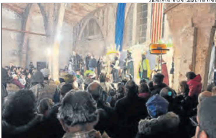
AJUNTAMENT DE SANT GUIM DE FREIXENET