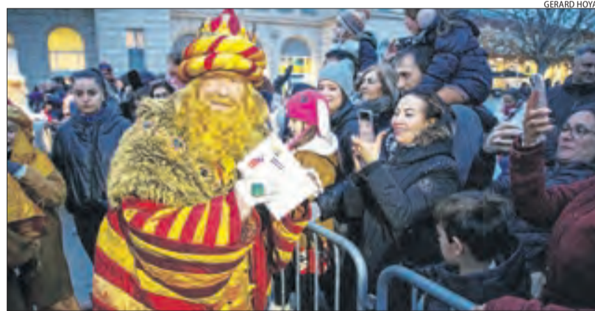
El rei Gaspar, rebent encara cartes amb els regals demanats.

En el seu discurs, Melchior va demanar als petits "estimar els pares, estudiar molt i empatia, ja que molts petits aquesta nit no podran rebre joguets". Per la seua part, Gaspar i Baltasar van llançar un missatge de "pau, alegria i amor".