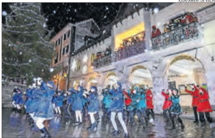
AJUNTAMENT DE VIELHA