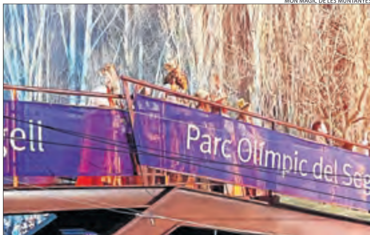
MÓN MÀGIC DE LES MUNTANYES