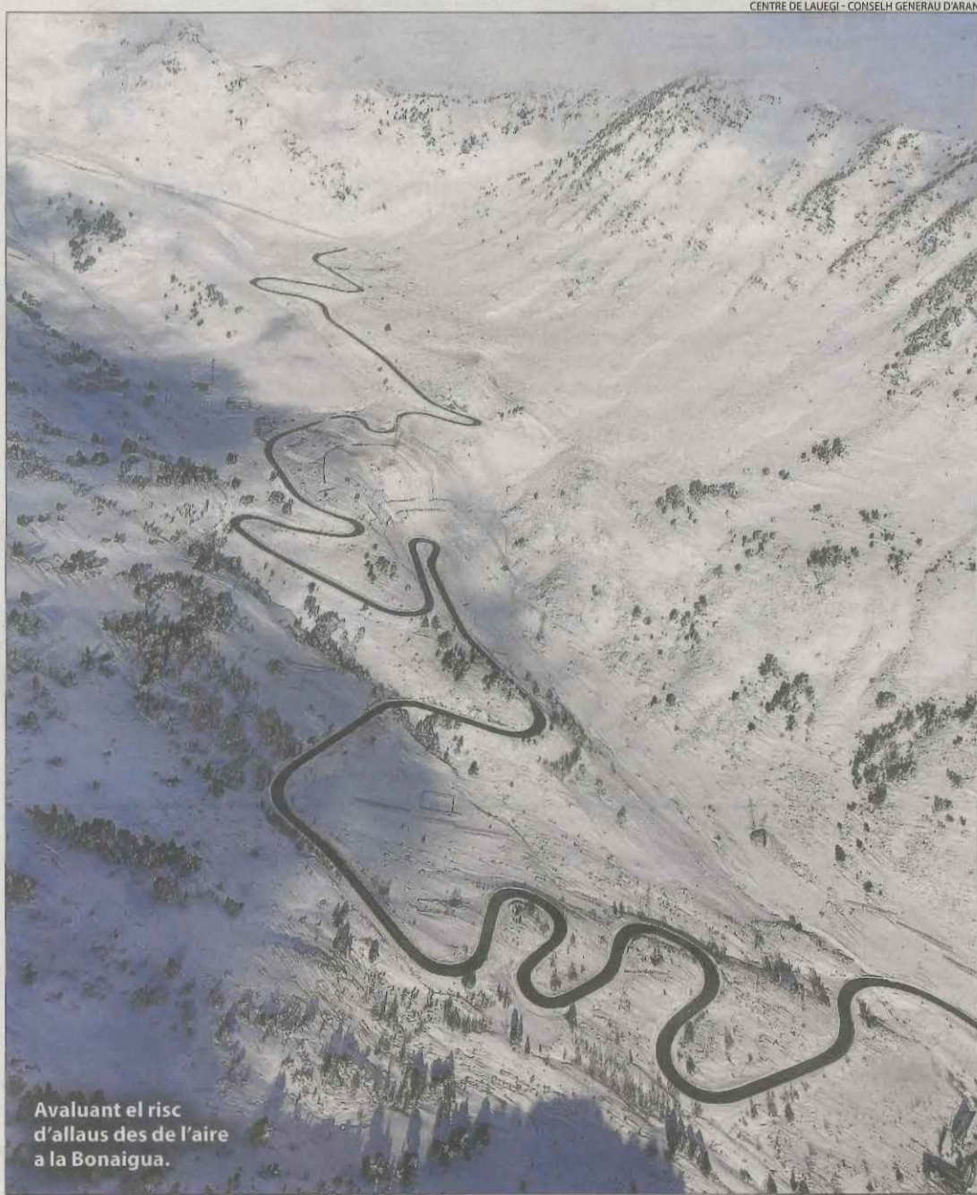
Avaluant el risc d'allaus des de l'aire a la Bonaigua.

Una jove va resultar ferida de caràcter greu a primera hora de la tarda de dilluns quan va ser arrossegada per una allau de neu mentre practicava esquí de muntanya a Tredòs, a la Val d'Aran, amb quatre persones més, segons ha pogut saber aquest diari. Els companys van avisar els serveis d'emergència i va poder ser rescatada i traslladada a l'hospital de Vielha.