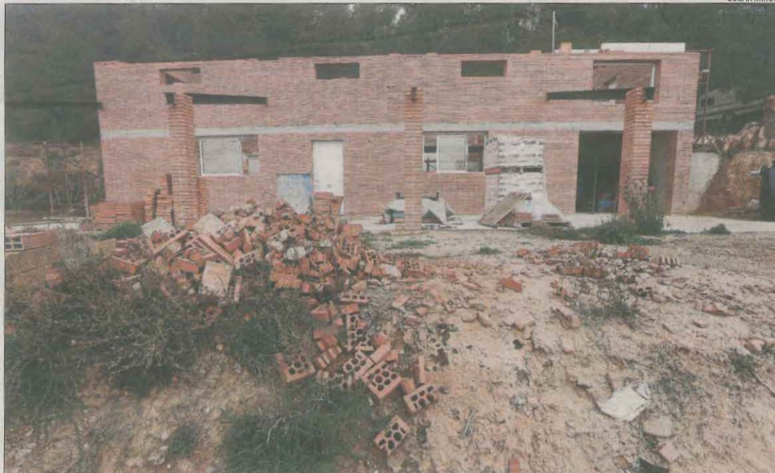
Imatge d'arxiu de l'edifici en construcció declarat il·legal a Almenar el gener del 2018.

desmantellat una construcció prefabricada de fusta de 25 metres quadrats i una construcció de formigó de 20 metres quadrats. Queden per demolar els fonaments de les dos edificacions. A Isona i Conca Dellà, es va demolar un edifici de maons amb dos plantes, una terrassa i una escala exterior d'uns 25 metres quadrats construït sense permisos. Tampoc no els tenia l'edificació enderrocada a Les, de planta rectangular i format per dos plantes. En aquest cas, s'ha tornat al seu estat original una superfície de 105 metres quadrats.