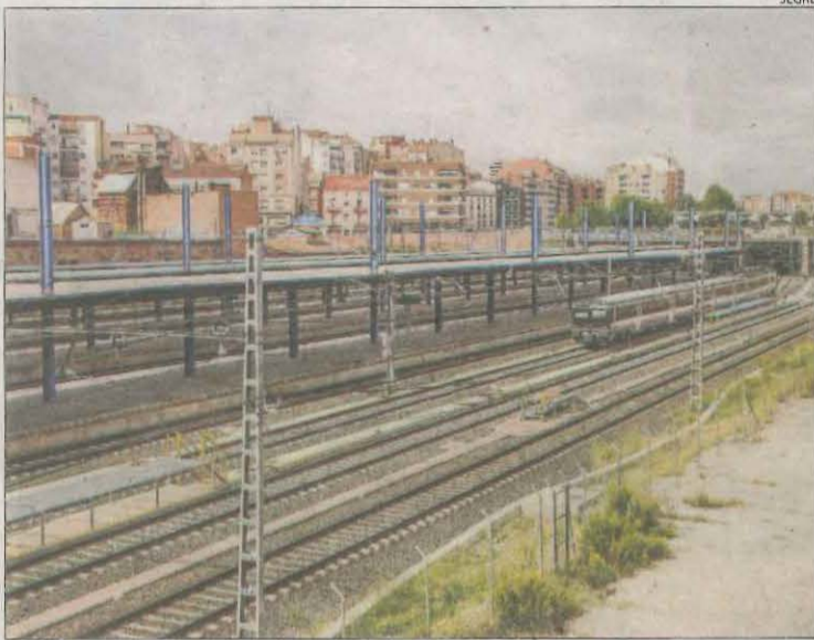
Un tren de les línies de mitjana distància a l'estació de Lleida.

Faran dos avisos als qui reservin seients que no usin sense haver-los cancel·lat amb una hora d'antelació