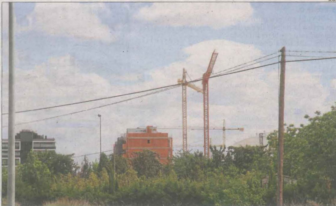
Imatge d'arxiu d'habitatges en construcció a Lleida.

L'informe analitza també l'esforç familiar econòmic que es destina a l'habitatge i al Segrià és el 15,9% al lloguer i el 14,5% a la hipoteca. A la Noguera és el 13,8% i el 17,1%, respectivament; el 15,5% i l'11,6% al Pla d'Urgell; el 13,7% i 11% a la Segarra; el 14,1% i 10,9% a l'Urgell; i el 14,6% i 8,8% a les