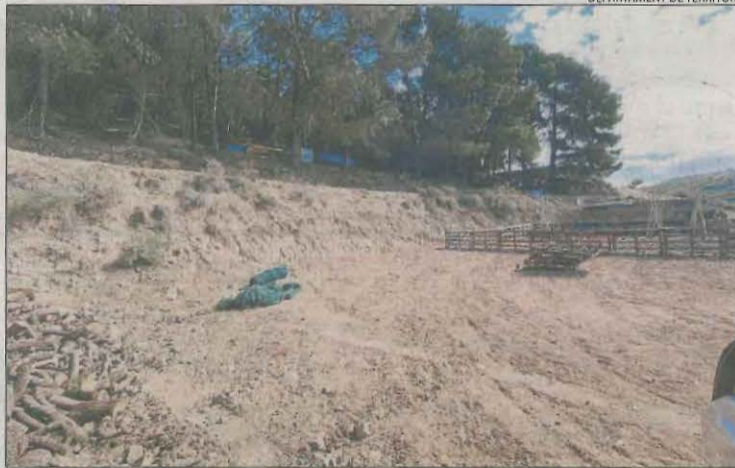
Els terrenys que ocupava l'edifici després de la demolició voluntària.

desmantellat una construcció prefabricada de fusta de 25 metres quadrats i una construcció de formigó de 20 metres quadrats. Queden per demolar els fonaments de les dos edificacions. A Isona i Conca Dellà, es va demolar un edifici de maons amb dos plantes, una terrassa i una escala exterior d'uns 25 metres quadrats construït sense permisos. Tampoc no els tenia l'edificació enderrocada a Les, de planta rectangular i format per dos plantes. En aquest cas, s'ha tornat al seu estat original una superfície de 105 metres quadrats.