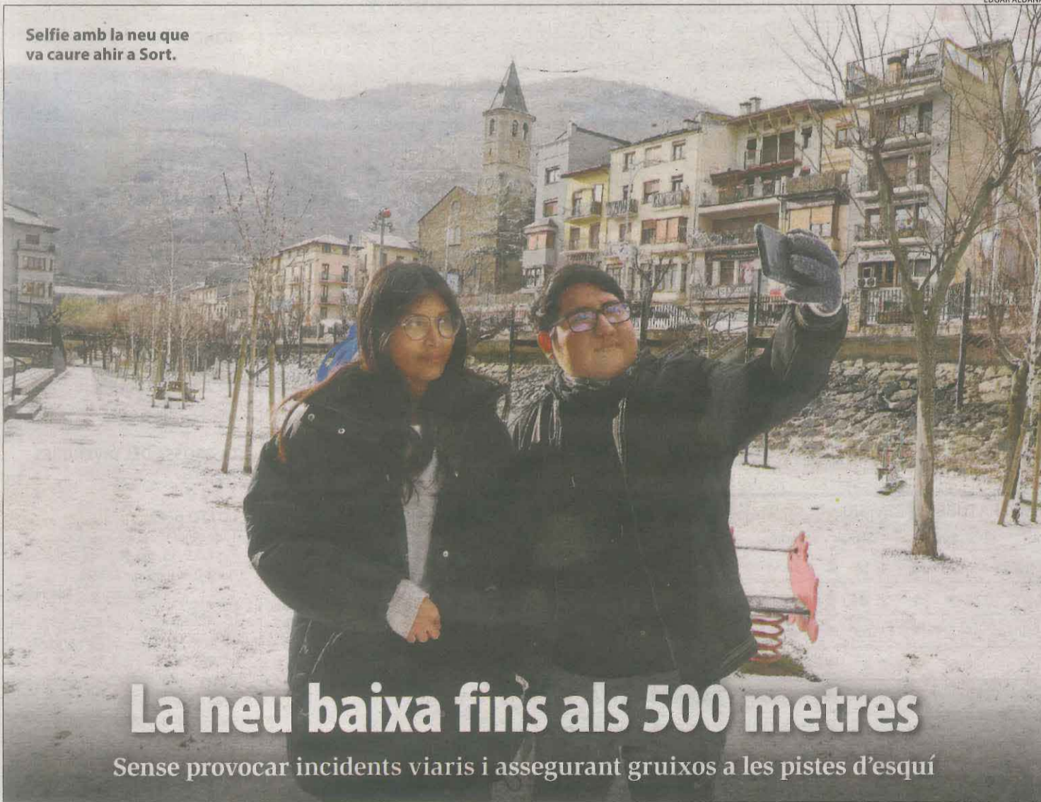
Selfie amb la neu que va caure ahir a Sort.