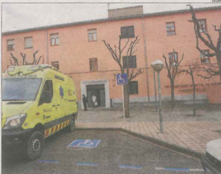
Imatge d'arxiu de la residència Fiella de Tremp.

A més de l'exdirectora del geriàtric, R.N., i l'exresponsable d'Higiene Sanitària, M.R.N.O., la jutge també ha citat a declarar com a investigats els membres del Patronat de la Fundació Sant Hospital de Tremp. Serà dimarts vinent i compareixeran després de la querella que va interposar contra ells la matei-