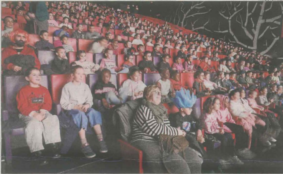
Una de les primeres sessions per a escolars d'Animac, ahir al matí a la Llotja de Lleida.

També hi participaran escoles d'educació especial. A més, Animac oferirà una sessió escolar fora de la ciutat de Lleida, demà a l'espai cultural La Lira de Tremp, per a un centenar d'alumnes de l'Escola Maria Immaculada de la capital del Pallars Jussà.