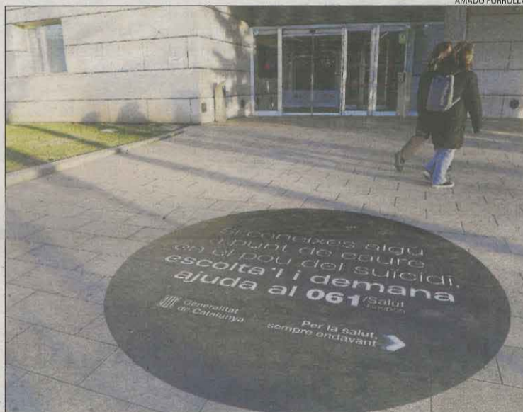
Un vinil de la campanya, al campus de la Udl a Cappont.

Morts per aquesta causa notificades durant l'any passat a Catalunya, segons les dades de l'INE