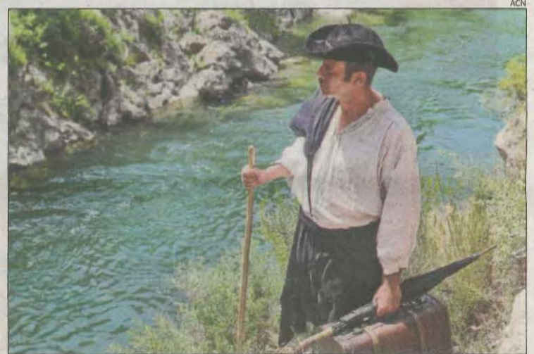
Rodatge del film, l'estiu del 2022 al congost de Collegats.