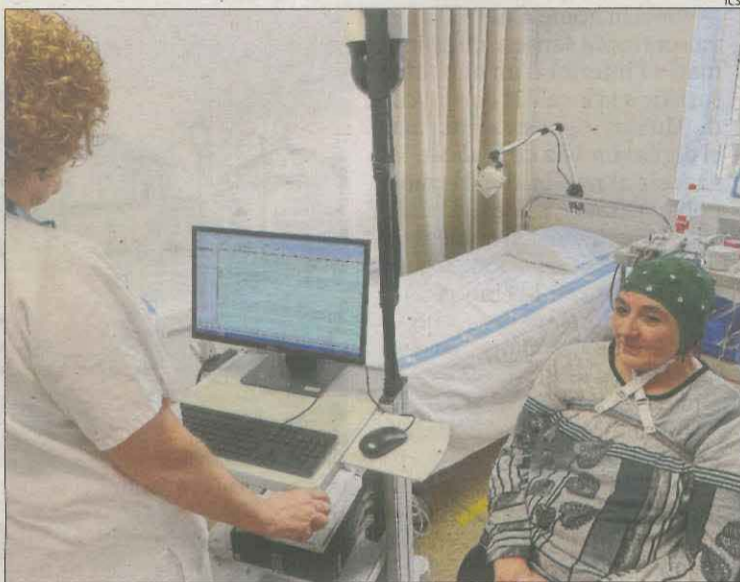
Una pacient, durant una consulta a l'Arnau de Vilanova.