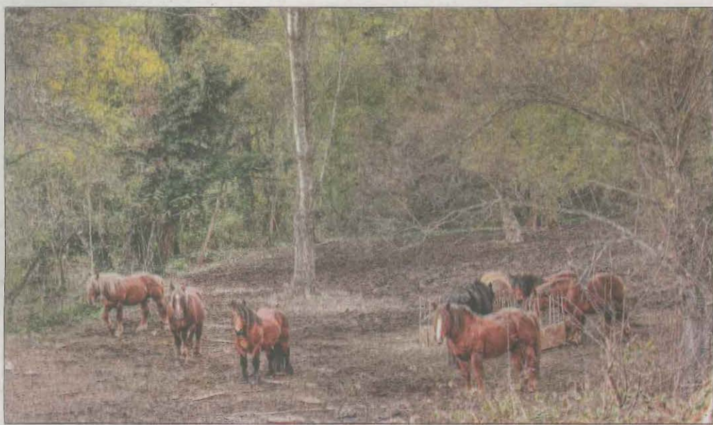
Hi ha més vida. Uns cavalls a la Vall Fosca, per @blanca_martinez_fotografia.