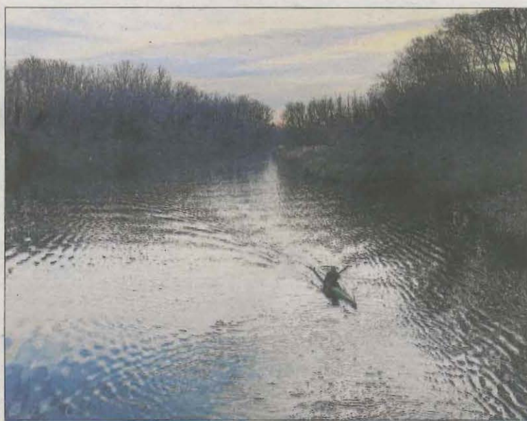
Solitud. Un piragüista a la Mitjana de Lleida, per @poeta_anonimo_.