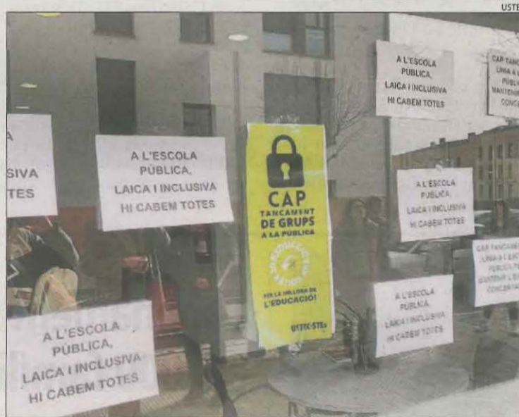
Imatge de la protesta d'ahir a la seu d'Educació a Tremp.

El Govern diu que les famílies han de manifestar que volen canviar de centre i s'estudiarà el cas