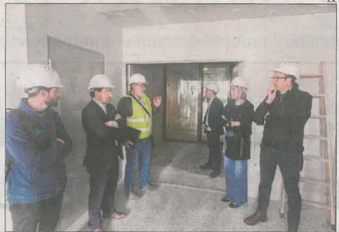
Les autoritats durant una visita a les obres del CUAP.