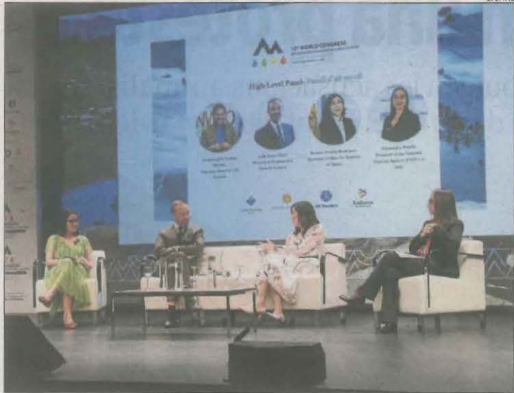
Un moment del Congrés Mundial de Turisme d'Andorra.

Un dels atractius de la Setmana Santa és la possibilitat de combinar l'esquí amb el ràfting, que ja ha començat la campanya. La temporada de neu encara la recta final amb bons gruixos després de la nevada de principis de mes i Ferrocarrils va confirmar ahir que Boí Taüll, Espot i Port Ainé tancaran el 7 d'abril. L'estació de l'Alta Ribagorça, a més, tornarà a obrir els dies 13 i 14. El patronat estima que es vendran més de 100.000 forfets. Pel que fa als esports d'aventura, Lleida compta amb unes 270 empreses que ofereixen unes cinquanta activitats.