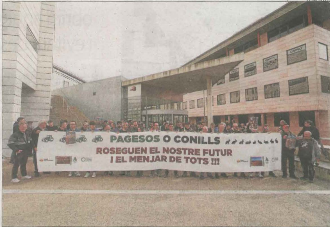
Concentració de suport davant del jutjat a UP, JARC, Asaja i FCAC, citats ahir a declarar.

Les declaracions van formar part de la instrucció de la causa oberta arran de denúncies del partit animalista PACMA i l'associació Lex Anima. Participants en la manifestació van llançar conills a l'entrada de la conselleria d'Acció Climàtica a Lleida. Poc després, hi va haver forcejaments a la porta entre manifestants que provaven d'entrar a l'edifici i Mossos que intentaven impedir-ho. Els animalistes van denunciar que algun dels conills va acabar morint durant aquesta picabaralla. La resta van ser capturats i traslladats a la facultat de Veterinària de la UdL. Els sindicats i la FCAC van figurar com a convocants de la manifestació, ja que Pagesos o Conills no estava constituïda com a associació. Tant els que van declarar davant del jutge com la plataforma van dir no