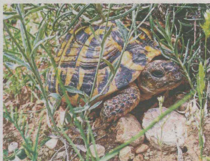
Un exemplar de tortuga mediterrània

Des de l'any 2015, han alliberat un total de 291 exemplars de tortugues procedents del Centre de Recuperació d'Amfibis i Rèptils de Catalunya i els concentrats a la vall de Bovera han augmentat en un 61% els últims tres anys.