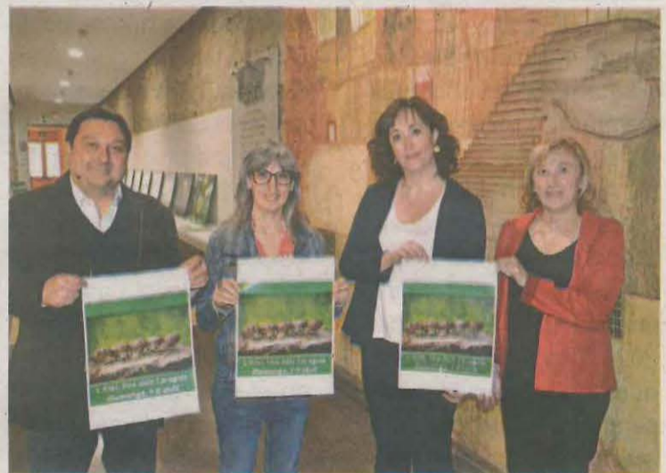
La Fira es va presentar ahir a la Diputació