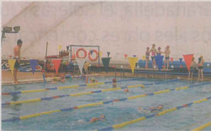
Imatge d'arxiu de la piscina de l'Acadèmia de Talarn

Aquest conveni permet que qualsevol persona