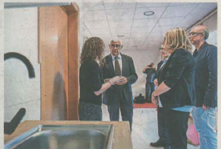
FOTO_Salut Visita del conseller Balcells a l'equipament

de Salut, Manel Balcells, el va visitar i va destacar que suposa una "millora molt important de proximitat". Segons Salut, l'espai hauria de permetre optimitzar els recursos en aquesta part del país en l'àmbit de l'atenció a la salut mental infantil i juvenil.