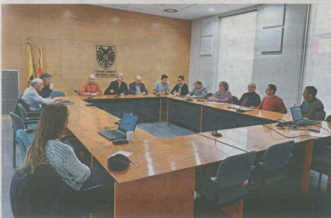
Reunió entre alcaldes del Pallars Jussà i el Govern al Consell Comarcal