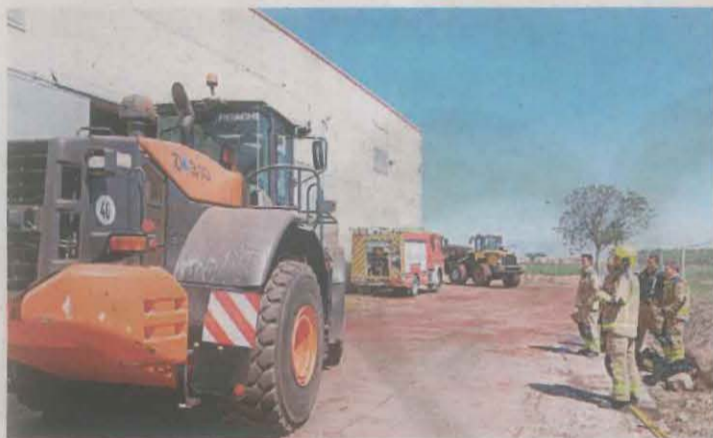
Va tenir lloc al Camí de l'Estació.

01.06 hores i es van activar quatre dotacions dels Bombers. Els residents van poder sortir, però el pis va quedar malmès pel fum i van haver de passar la nit fora.