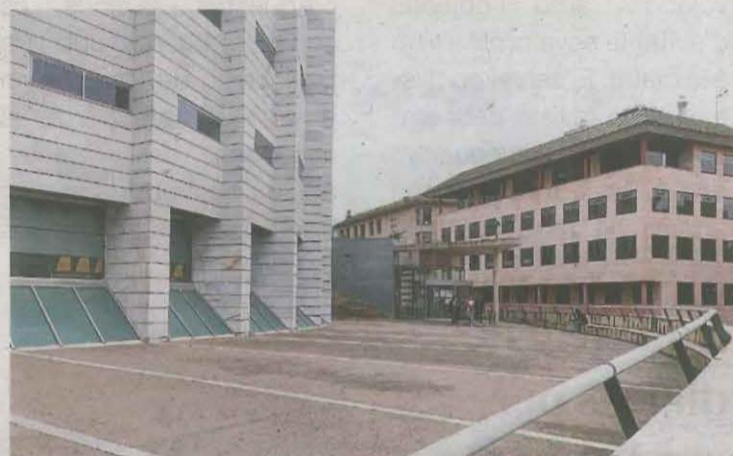
Imatge de l'exterior dels jutjats de Lleida, on ahir van declarar sis dels detinguts pels fets

L'operació de la Guàrdia Civil de Lleida va mobilitzar uns 90 agents de diferents especialitats del cos, amb la col·laboració de la policia local. Es van detenir 8 persones i van dur a terme una desena de registres en diferents punts del municipi i van