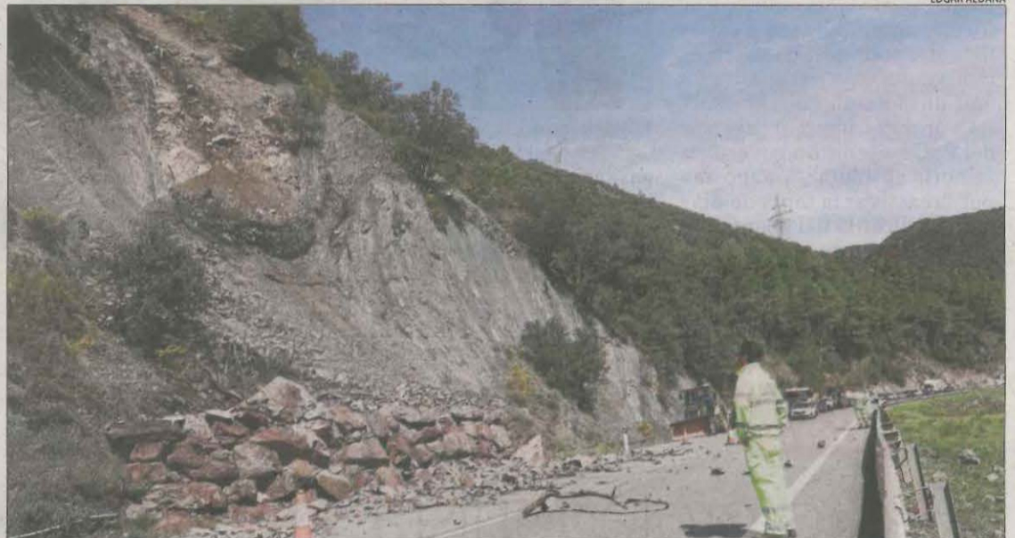
Operaris treballant en el pendent per retirar les pedres més inestables.

R. R. | SORIGUERA | Un despreniment de roques sobre la calçada de l'Eix Pirinenc (N-260) al seu pas per Baro, al municipi de Soriguera, va obligar ahir a tancar la carretera entre les nou i les deu del matí. Des d'aleshores, operaris de Carreteres van donar pas alternatiu mentre provocaven la caiguda controlada de pedres despreses per evitar noves esllavissades. El d'ahir va ser el segon despreniment en aquesta carretera al seu pas pel Pallars Sobirà en un mes. El 9 de març passat una altra allau va afectar la circulació a la via que va estar un dia tancada, entre la Pobla de Segur i Baix Pallars, a la zona de la font de la Figuereta.