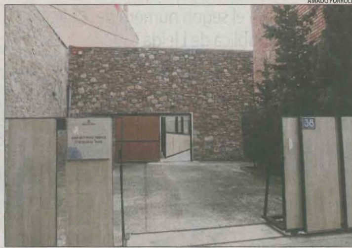
Imatge del jutjat de Tremp.

Val a recordar que al gener va declarar com a imputada l'exdirectora del geriàtric de Tremp, que va culpar les monges del brot de covid. Va afirmar que no hi va haver caos ni va faltar material com apunten Mossos, empleats i Fiscalia. També va comparèixer per videoconferència l'altra investigada, l'exresponsable