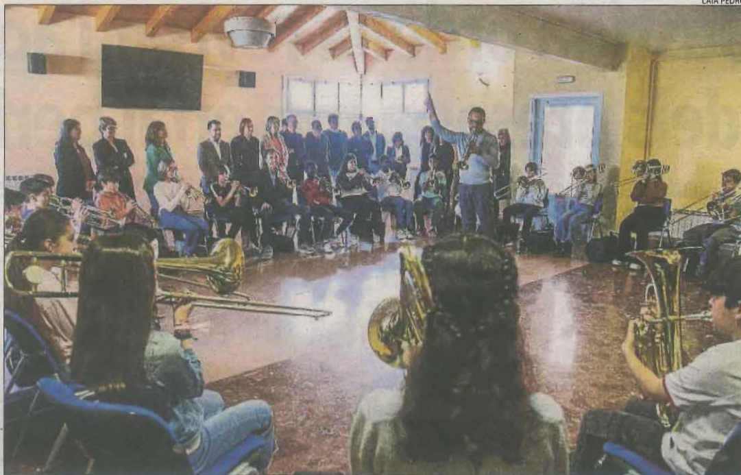
Aragonès va conèixer algun dels projectes del Pla Educatiu d'Entorn de Tàrraga.