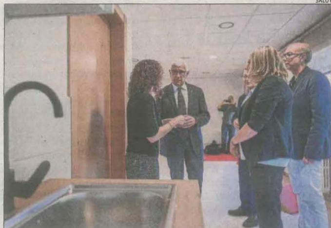
Visita del conseller de Salut al futur hospital infantil.