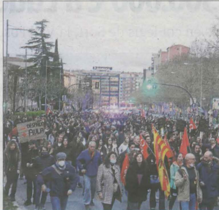
Imatge d'arxiu d'una manifestació de docents.

El decret d'autonomia de centres indica que per evitar perjudicis majors a l'educació de