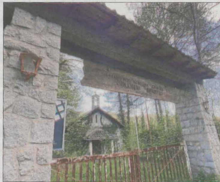
L'edifici de les colònies era propietat d'una immobiliària.

Per a la resta d'equipaments, "l'objectiu és que la rehabilitació doni resposta a les necessitats que puguin tenir els veïns", va assenyalar l'ajuntament en un comunicat. El complex de les antigues colònies inclou una piscina, una pista de bàsquet i una altra de patinatge que es troben molt deteriorades per culpa del pas del temps i l'abandó.