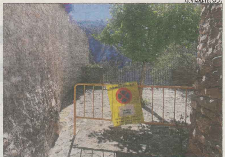
L'ajuntament ha tallat l'accés a una plaça per precaució.

tenció. Val a recordar que diversos desprendiments de roques van danyar el mes passat una casa al nucli de Santa Engràcia de Tremp i que estudis de l'ICGC van aconsellar mesures per estabilitzar el pendent.