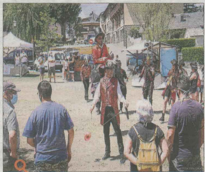
Com el flautista d'Hamelín, Improvisto's portarà la gresca al poble amb La Cirquestra

al poliesportiu. Des d'espectacles participatius en què el públic tindrà un important paper fins a funcions de titelles i exhibicions acrobàtiques: la màgia del circ farà les delícies de grans i petits d'una manera divertida i amb l'objectiu també de dinamitzar el poble. A més a més, el dissabte a les 21 hores el grup de Balaguer Bandelpal, amb la col·laboració de l'Associació de Dones del poble, farà retronar els carrers amb els seus tambors al ritme de batucada.