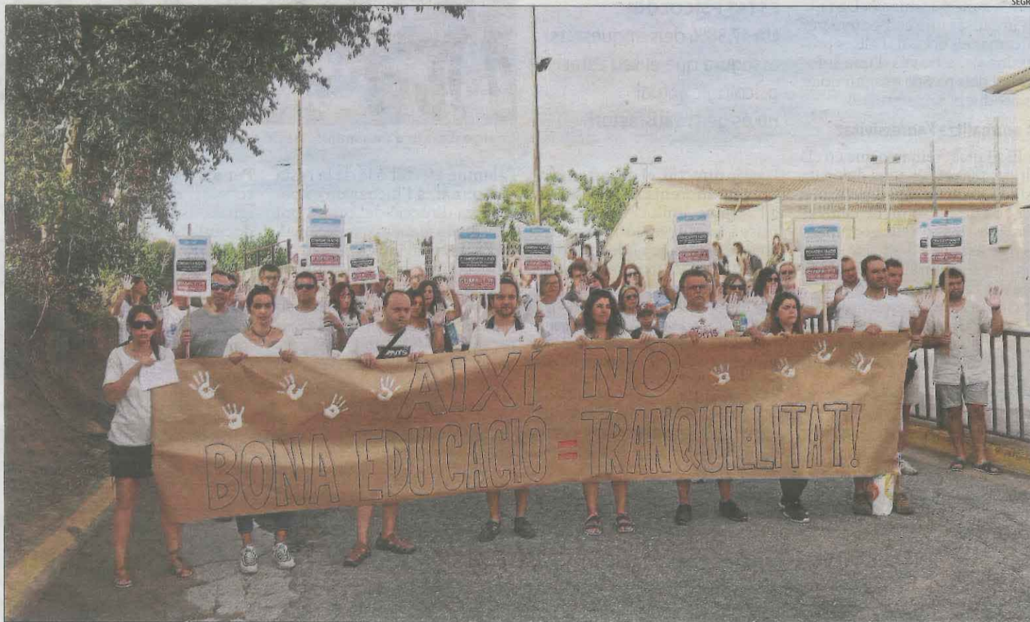
Una de les protestes contra aquest mestre per part de pares i mares a Artesa de Segre el setembre del 2022.

que la sentència de l'any 2015, encara que li va atorgar una indemnització, va descartar explícitament que hi hagués mòbing, mentre que la del 2019 que va anul·lar la seua exclusió de la borsa d'interins ho va fer no perquè l'avaluació d'Inspecció al docent fos tendenciosa, ja que la va ratificar, sinó perquè llavors portava 27 anys exercint i la normativa obliga que aquesta avaluació a interins es faci en el període de prova inicial. Destaca que la jurisprudència indica que no es poden equiparar a l'assetjament totes les afecions vinculades a situacions de tensió laboral i que l'escola d'Artesa el va tractar igual que a qualsevol altre docent. Ara, el mestre té l'opció de recórrer a la via judicial.