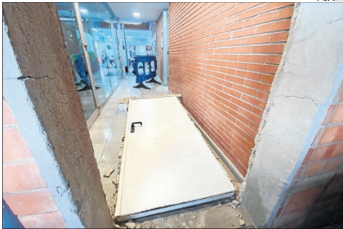
Imatge d'una de les portes destrossades de l'equipament.

D'altra banda, la policia catalana va detenir dimarts un home de 46 anys que compta amb 26 antecedents com a presumpte autor del robatori amb força en una casa dels Alamús que es va produir el passat dia 21 d'on van sostreure diners, joies i un rellotge. Van forçar una reixa i una finestra. L'individu va ser arrestat dimarts al matí al carrer Hostal de la Bordeta i