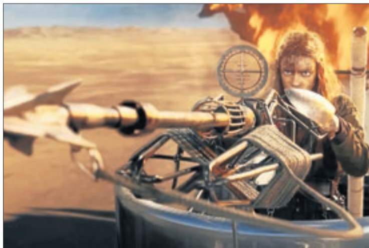
Anya Taylor-Joy, protagonista de la nova entrega de 'Mad Max'.

mite, l'havia posat al dia i, per molt que ens posem exquisits, no es pot obviar l'enorme talent d'aquest home per deixar-nos enganxats a la butaca davant un aparatós producte que et deixa sense alè.