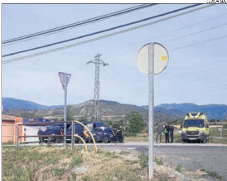
Patrulles ahir de la Policia Nacional a Talarn.

Els Mossos van intervenir uns 200 quilos d'aquesta droga en el macrooperatiu de dimarts a Ponent