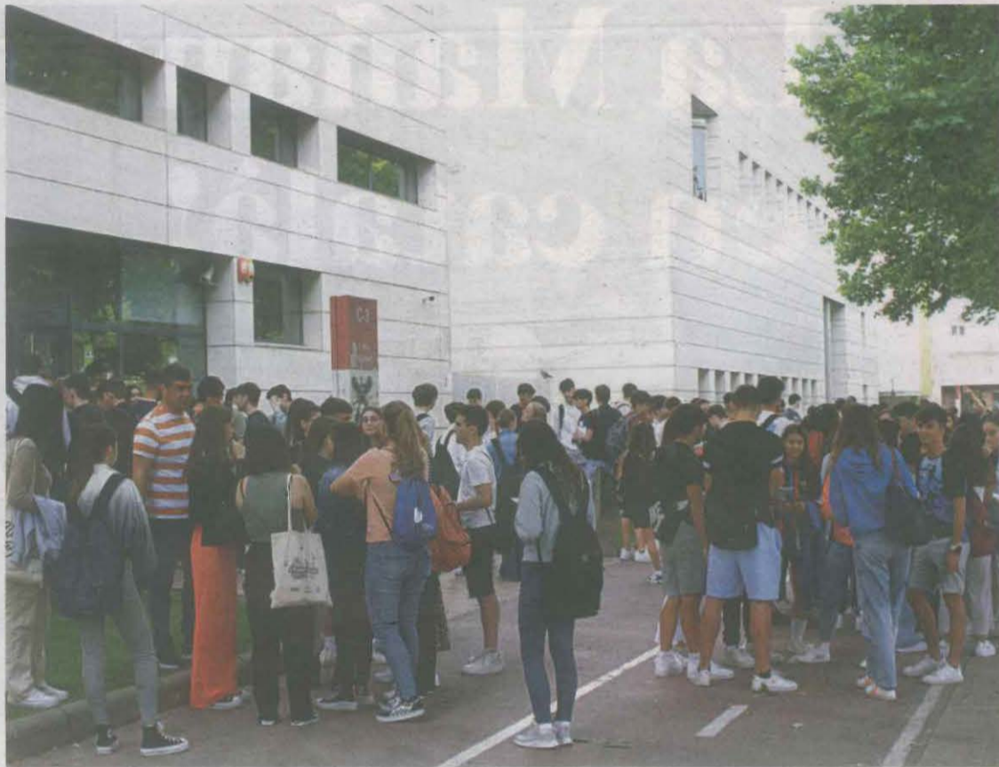
La selectivitat de l'any passat, al Campus de Cappont

De total de l'estudiantat que s'hi presenta, 1.916 són estudiants que han acabat el Batxillerat aquest curs mentre que 270 es presenten per lliure i provenen de Batxillerat d'altres anys sense haver fet prèviament la selectivitat o d'altres que volen millorar nota o només s'examinen d'assignatures de la fase específica. La resta, 233, provenen de Cicles Formatius de Grau Superior i s'examinen d'alguna assignatura de la fase específica. A Lleida ciutat és el Campus de Cappont el