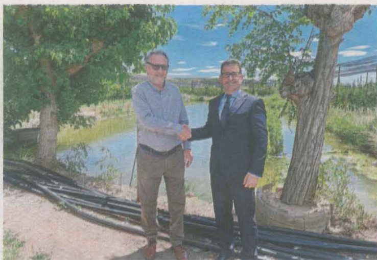
L'acord es va segellar ahir a Lleida

El projecte de modernització del Sector 3 té un pressupost d'un 25 milions d'euros i afecta un total de 2.067 hectàrees de la Comunitat General de Re-