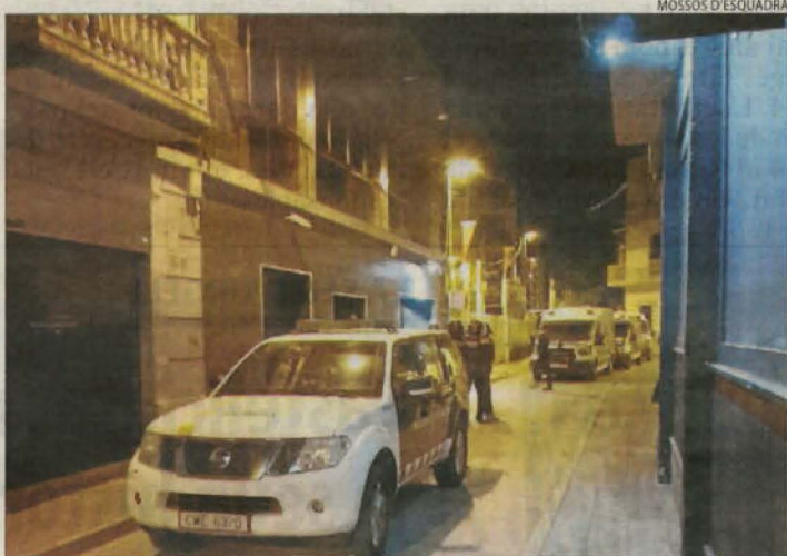
L'operatiu es va fer diumenge a la matinada.