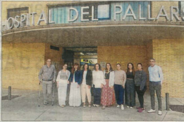
Algunes de les alumnes i les autoritats es van trobar ahir.

D'altra banda, durant tot el mes d'octubre a Tàrrrega s'informarà la ciutadania sobre la implantació del sistema de recollida porta a porta i es donarà el material. Començarà a principis de novembre amb les fraccions orgànica i resta. Els contenidors d'aquestes fraccions es retiraran, si bé hi haurà àrees d'emergència.