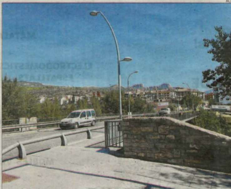
La paret on es trobava la placa del passeig Josep Borrell.

per decidir si es canviava el nom del passeig Josep Borrell. Els votants van poder escollir entre mantenir-lo o reanomenar-lo pel d'1-O. El 78% van votar canviar-lo. El ple de l'ajuntament va aprovar al març el canvi de nom, però no hi ha cap placa nova. La Federació del PSC a Lleida i el Pirineu defensa que Borell "ha estat un dels polítics amb més transcendència del país i que més ha treballat" pel territori.