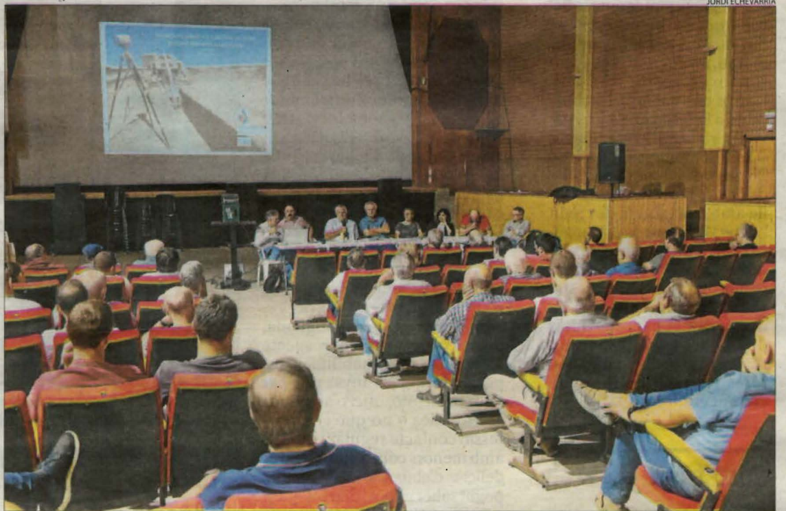
La reunió mantinguda ahir a Castellldans per informar del final de les obres en aquest nou sector.

El pantà de l'Albagés va servir d'aigua l'abril del 2021 per primera vegada des de la construcció de la presa que va quedar acabada el 2017 i la primera finca agrícola que va proveir, d'una superfície de 8,24 hectàrees, va ser del Cogul.