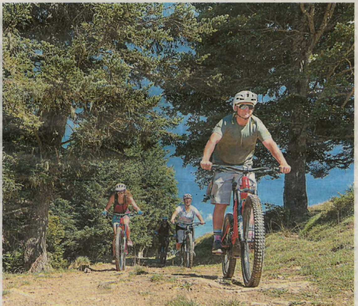
Usuaris de bicicleta elèctrica fent un recorregut