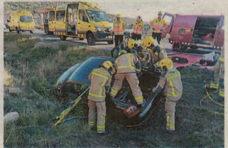
Moment en què era excarcarat

Un conductor va resultar ahir ferit de caràcter lleu quan el seu vehicle va sortir-se de la via al quilòmetre 123 de la C-14, a Vilanova de l'Aguda. Els Bombers el van excarcarer i els SEM el va traslladar a l'Hospital Arnau de Vilanova.