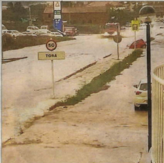
Torà va registrar pluges intenses en poc temps.

El president de la CHE va instar a "ser més reflexius" davant de tempestes com la dana que ha sacsejat la Mediterrània des de fa una setmana perquè "aquests fenòmens són cada vegada més freqüents" i alhora