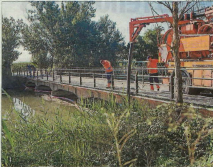
Els treballs per aturar l'abocament a Utxesa el 2021.